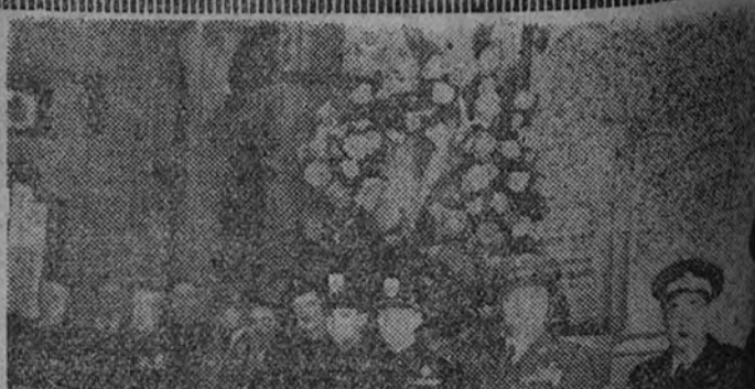
Representación de la Embajada de Italia, Fascio de Madrid y Militar italiana, reunidos en la Casa del Fascio para conmemorar el aniversario de Vittorio Veneto, en recuerdo del heroísmo del soldado italiano en los campos de batalla.