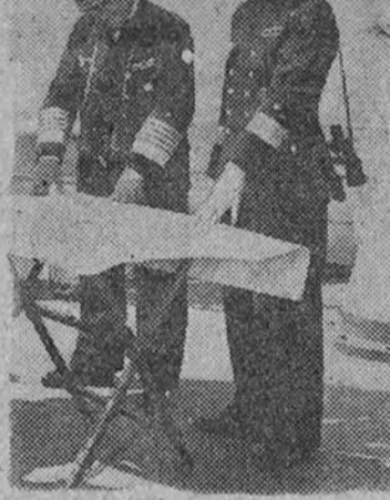
Comandantes de unidades de la flota alemana con las Cruces de Hierro recientemente impuestas por su heroico comportamiento en los últimos hechos navales.

Alambrados y bajonetas. Así viven los tripulantes del submarino alemán tipo "U" que referencias británicas aseguran haber sido capturados por la Marina del Imperio.