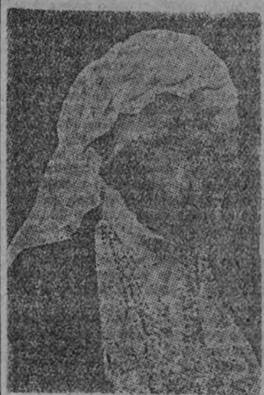
La Reina Guillermina de Holanda

Se descarta la posibilidad de una acción militar soviética contra Finlandia