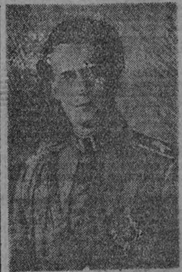
El Rey Leopoldo de Bélgica

BERLIN 7. (De la Redacción de la agencia Efe en la capital del Reich.)—Los periódicos destacan la protesta de Holanda y Argentina contra las normas impuestas por Inglaterra para lo-