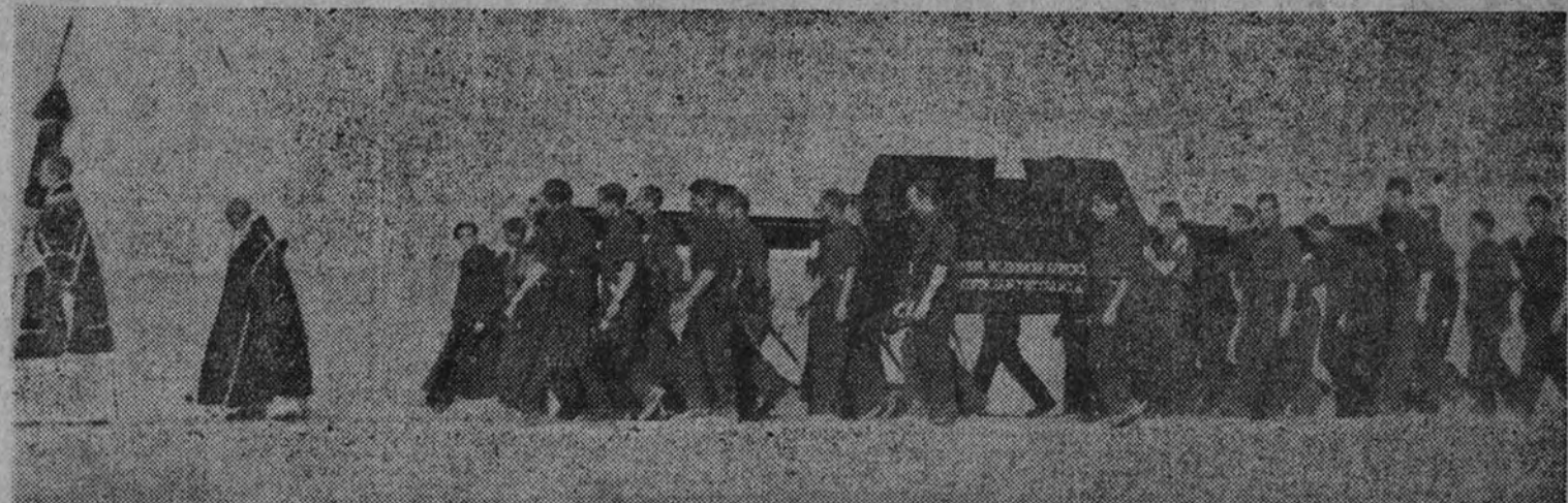
El entierro del siglo cruza la Mancha. En su última nave, José Antonio navega por estas tierras planas en que se acostaba mejor el sol, rodeado de camisas azules, pros al corazón del Imperio. El paisaje es firme como los hombres y duro como la luz sin sombra, como los pasos sin fatiga.

Poco a poco Almansa, emocionada y dolorida, va quedando atrás bajo el sol de noviembre. Carretera adelante, los árboles—como Garcilaso cantó con voz recia— parece que se inclinan a nuestro paso.