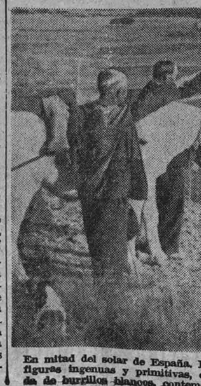
En mitad del sol de España. El sol, la primera del sol, pasa el cortejo. A un altísimo se elevan figuras ingenuas y primitivas, como de égloga. La España recorrida de alfornos y cava, de burullones blancos, contempla el relevo de España a lo largo de la muerte.

Posteriormente, en el kilómetro 135, se hará cargo de la conducción la representación de Huesca. Otro relevo se verificará en el kilómetro 142 alrededor de las siete de la mañana, encargándose Navarra. La llegada a Chinchilla se calcula tendrá efecto en las primeras horas de la mañana, correspondiendo a las milicias de Zaragoza el honor de proseguir la conducción de los restos. (Mencheta.)