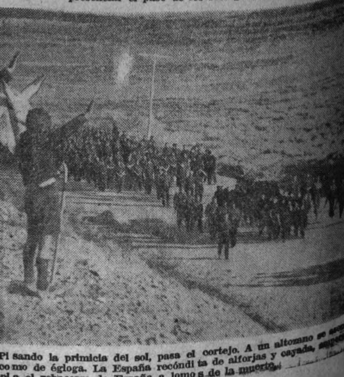
En mitad del sol de España. El sol, la primera del sol, pasa el cortejo. A un altísimo se elevan figuras ingenuas y primitivas, como de égloga. La España recorrida de alfornos y cava, de burullones blancos, contempla el relevo de España a lo largo de la muerte.