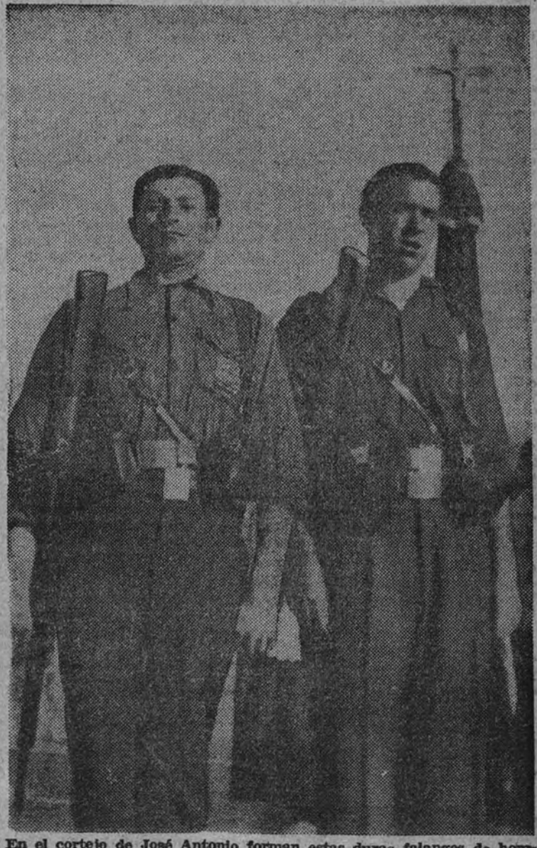
En el cortejo de José Antonio forman estas duras falanges de hombres del campo, surcadas las frentes por muchos soles, seco el gesto con sed de llanuras infinitas