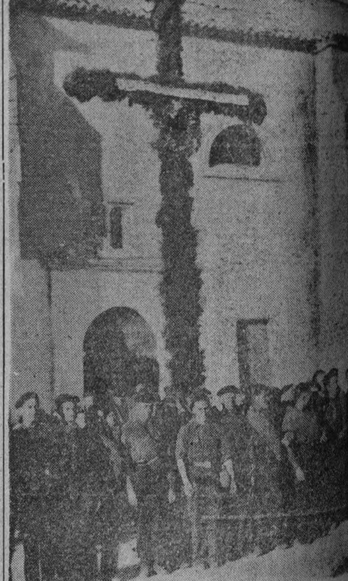
Las falanges de los pueblos españoles encienden las fachadas de las casas, levantan cruces de verdes ramas y forman a sus pies para presenciar el paso de los restos de José Antonio