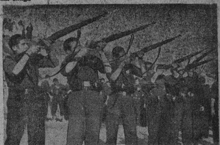
El momento de las salvas ante el féretro: hora exacta del fuego en homenaje, respuesta grave de los fusiles. Es temprano, y los pájaros de la mañana, alocados por el estruendo, serán todos golondrinas sobre el féretro de José Antonio