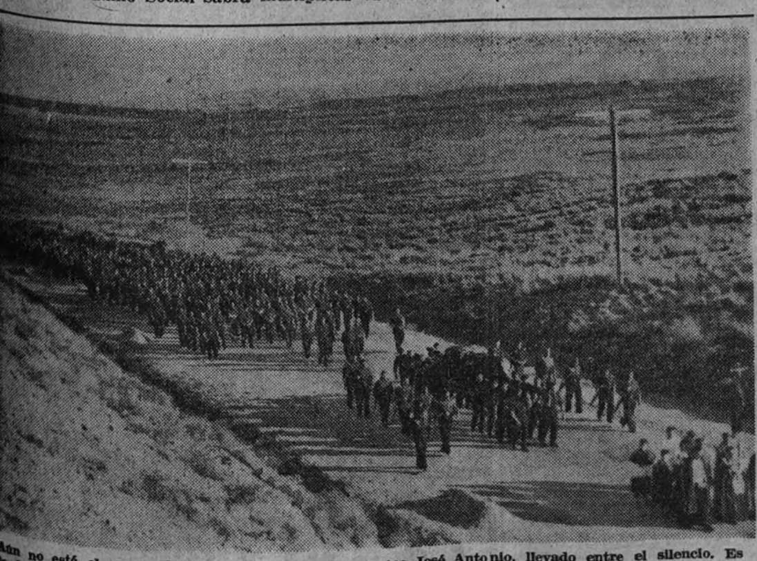
Aun no está el campo despierto del todo y ya amanece José Antonio, llevado entre el silencio. Es la hora del relevo en la guardia de las estrellas. Sobre la muerte, canta sin voz el renacer de todas las cosas. Gravita la Historia a hombros del cortejo y la geografía se somete en un suave desahucio de carreteras.

Español: Haz de tu Patria un pueblo de hermanos. Despréndete generoso y alegre de lo que te sobra o no utilizas en favor de los que nada tienen y todo les hace falta. Auxilio Social sabrá multiplicar tu esfuerzo.