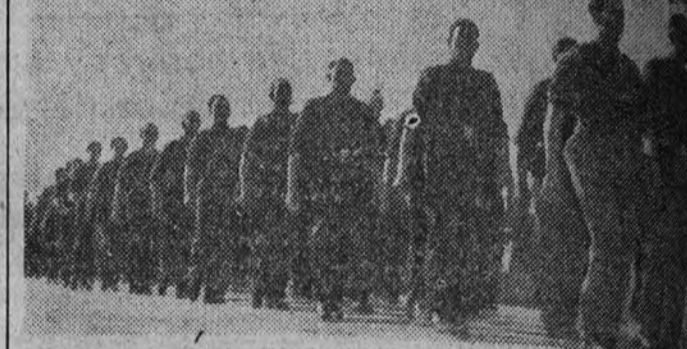
Falangistas prietas, curtidas. Son lo mejor del cortejo. Hombres que han vestido de azul por dentro y por fuera, que subrayan con su gesto y sus músculos todo el dolor de España. Y también toda la esperanza, toda la voluntad