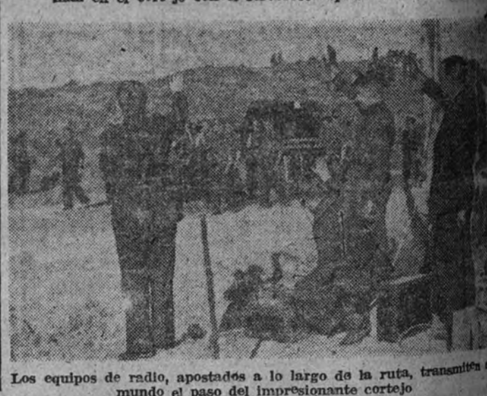
Los equipos de radio, apostados a lo largo de la ruta, transmiten al mundo el paso del impresionante cortejo.