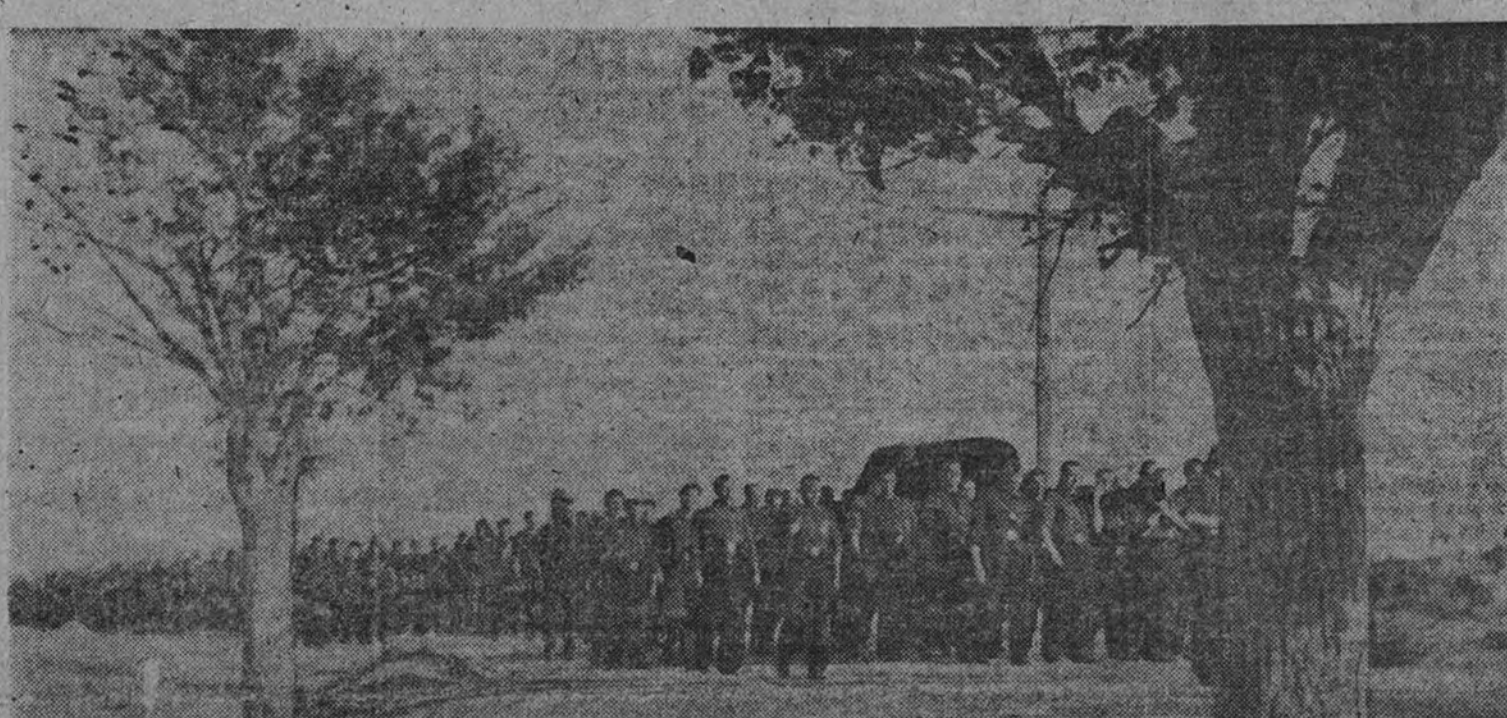
Cambia el paisaje y cambian los hombres; pero son la misma España y los mismos españoles. Idéntico ambiente e idéntica raza. La Falange: Geografía e Historia.

GENOVA 23.—La Misión fascista portadora de la corona de bronce que el Duce dedica a la tumba de José Antonio Primo de Rivera ha embarcado hoy en el paquebote italiano "Neptunia". Los enviados de Mussolini desembarcarán en Barcelona cuando el barco haga escala en este puerto y seguirán en tren su viaje a Madrid y El Escorial, donde será depositada solemnemente la corona. (Efe.)