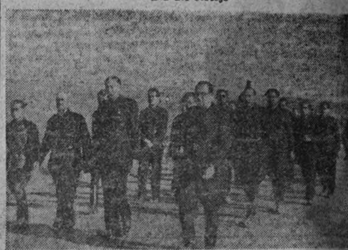
Las jerarquías de la Falange no abandonan tampoco su puesto, y permanecen en el cortejo con el fervoroso espíritu del militante.