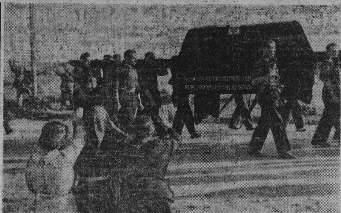
Por donde no hay poblado nunca faltan campesinos que salen a las márgenes de la carretera a rendir su tributo de saludos, lágrimas y oraciones a los gloriosos restos.