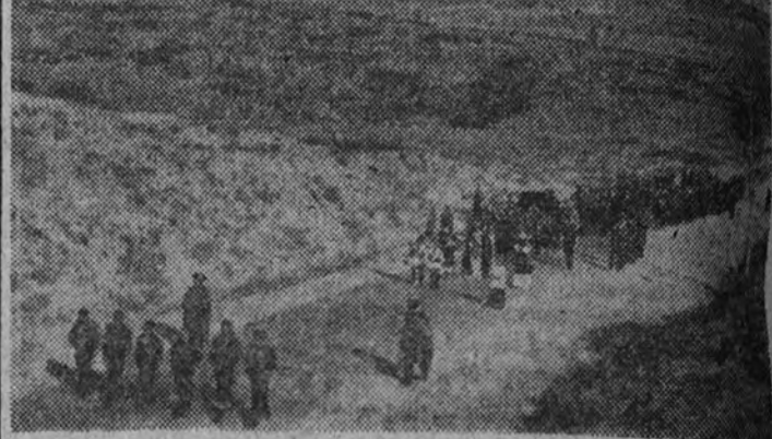
Entre la inhóspita soledad del paisaje se hace más patente la solemnidad del cortejo.

Los equipos de radio, apostados a lo largo de la ruta, transmiten al mundo el paso del impresionante cortejo.