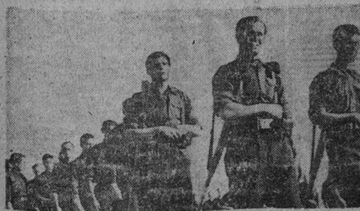
La Falange del campo en el cortejo de José Antonio.

Y este doloroso tránsito de tu muerte, José Antonio, pesará sobre muchas conciencias. Sobre todos los que no tuvieron cora- zón para comprender. Y te negaron todo, y te cerraron sus puer- tas. Tu muerte es hoy ejemplo de su miseria, acusación de su vi- leza. Porque nunca te olvidamos a ti, José Antonio, jamás les olvidaremos a ellos.