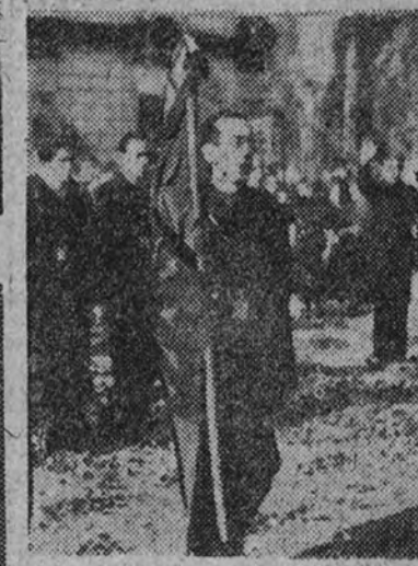
La bandera del Alcázar de Toledo, hecha con una sábana durante el asedio, llevada por un falangista en el recibimiento de los restos de José Antonio en Aranjuez

Tres rutas españolas, al correr de los tiempos, se paran frente al mar Mediterráneo: la del Cid, Valencia; la de D. Quijote, en Barcelona; y la de José Antonio, en Alicante. Desde la entraña de Castilla, que nos forma, arranza la primera; desde la entraña del Imperio formado, la segunda; desde la entraña descompuesta de una Patria perdida, la última. La antigua y la moderna las detiene la victoria en la muerte; la central, la derrotada en la vida.