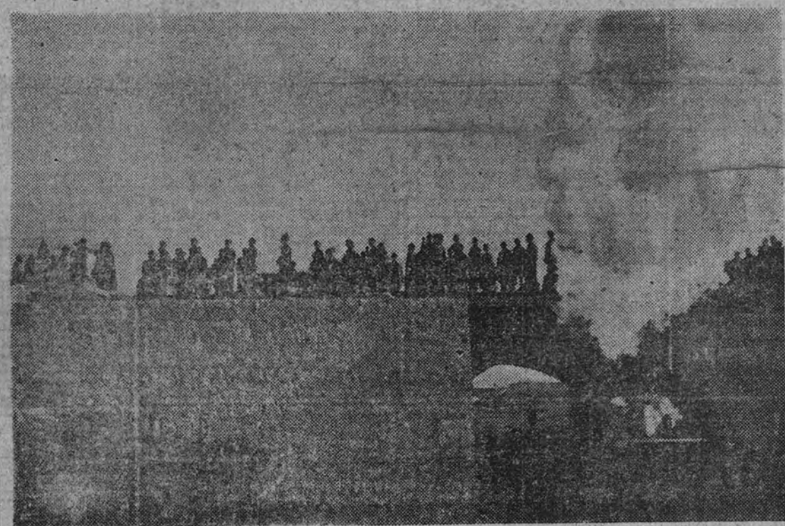
El paso del cortejo por el Puente Largo de Aranjuez