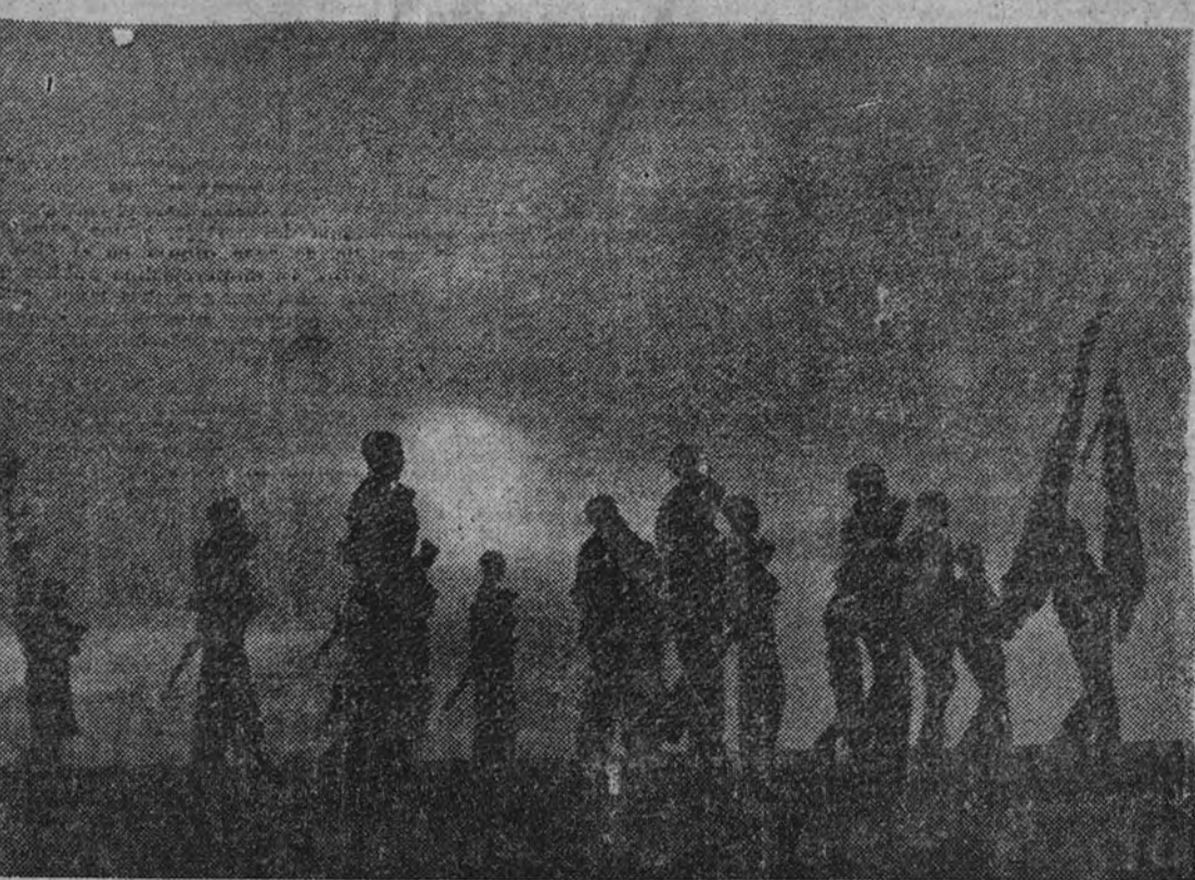
Abriendo la marcha del cortejo, las banderas enlutadas, los fusiles a la funeral y los falangistas avanzan al amanecer.