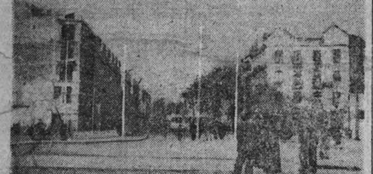
La plaza de Legazpi, por donde hará su entrada en Madrid la comitiva que conduce los restos de José Antonio