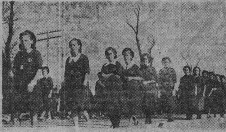
Camaradas de O. J. en el cortejo de José Antonio.