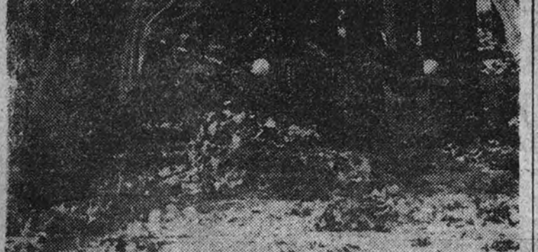
El féretro de José Antonio reposa un momento en el suelo de Aranjuez