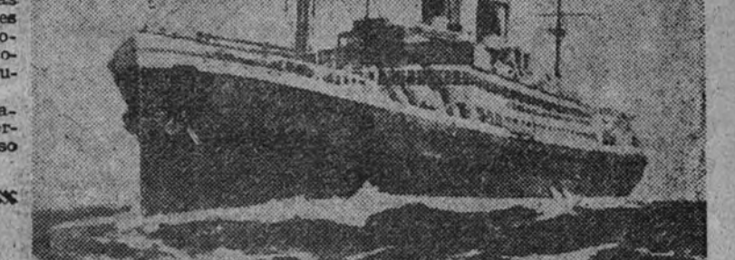
La dureza de la guerra de las minas puede ser sentida también por los buques de algunos países ribereños del mar del Norte. He aquí al "Simón Bolívar", de la Nederland Mail Line, que ha sido humido fren-

Mujer española: Auxilio Social llama a tu corazón de madre en interés del niño que, teniendo frío, carece de ropa que ponerse.