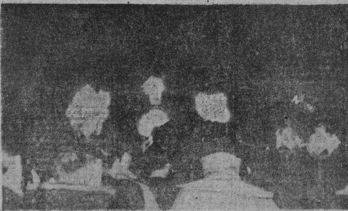
El cortejo, en las cercanías de Madrid, atraviesa la última noche antes de entrar en la capital