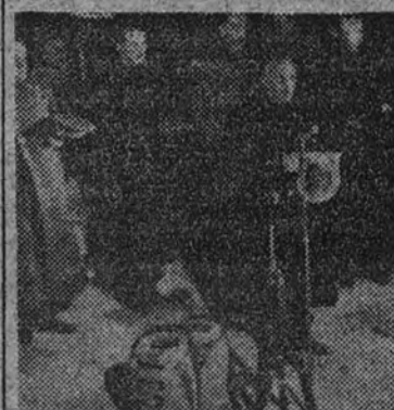
El Caudillo pronuncia ante la tumba de José Antonio las palabras finales de la ceremonia de dar sepultura a los restos gloriosos.