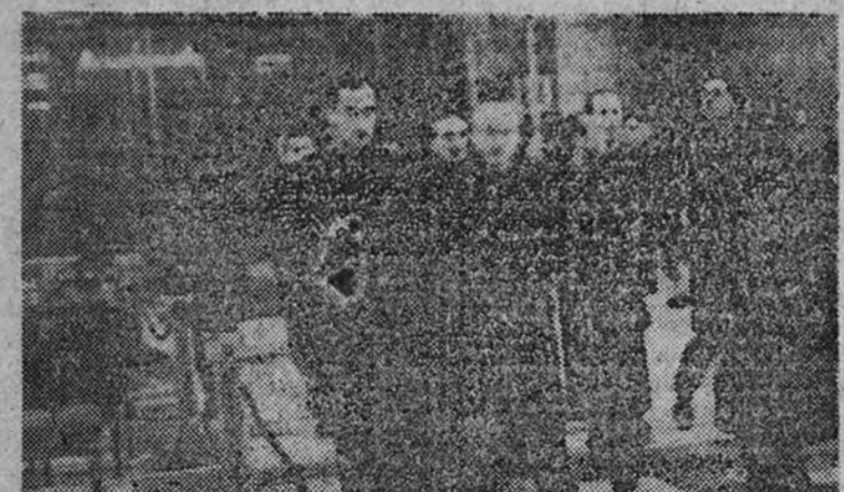
El presidente de la Junta Política, Miguel Primo de Rivera y otras jerarquías visitan el interior del templo antes de los actos celebrados al dar sepultura definitiva al Fundador de la Falange.