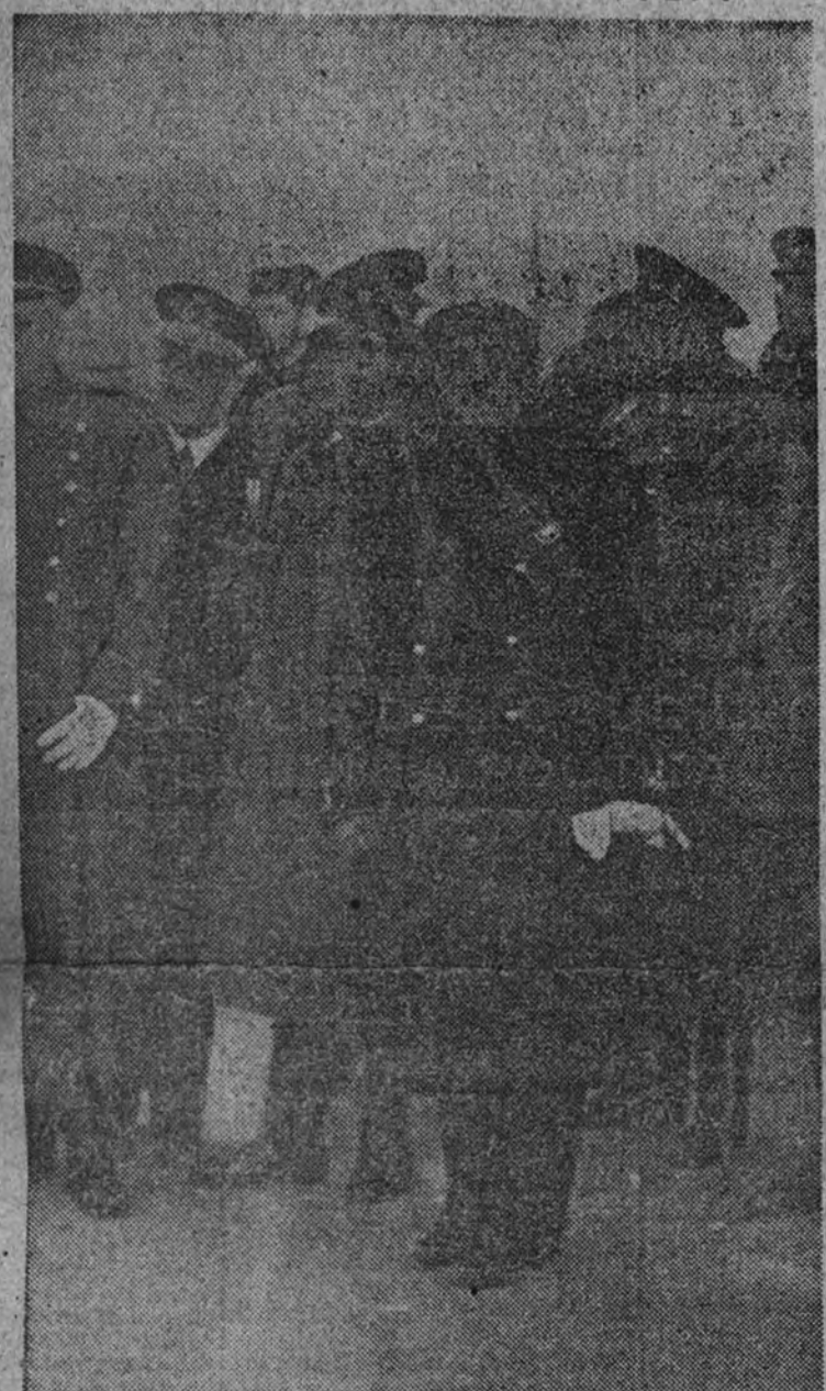
El Caudillo espera la llegada de los restos del Fundador de la Falange

PRESENCIA DEL CAUDILLO Y LA JUNTA POLITICA