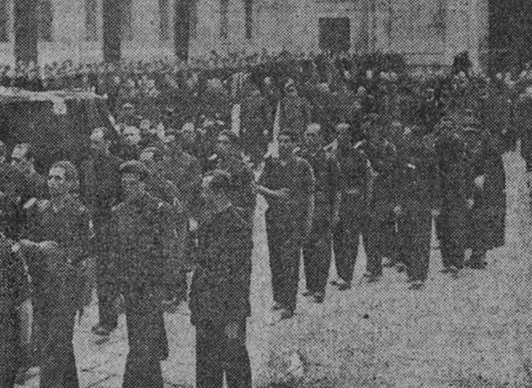
La comitiva entra por el Patio de los Reyes y se dirige a la basílica, donde recibirán sepultura los restos del Fundador