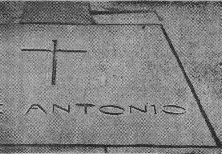
La piedra que cubre para siempre el cuerpo de José Antonio