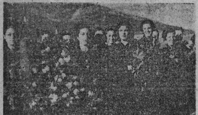
Camaradas de la Sección Femenina llevan ramos de flores para la tumba de José Antonio.

El Escorial, 30 de noviembre. Año de la Victoria.