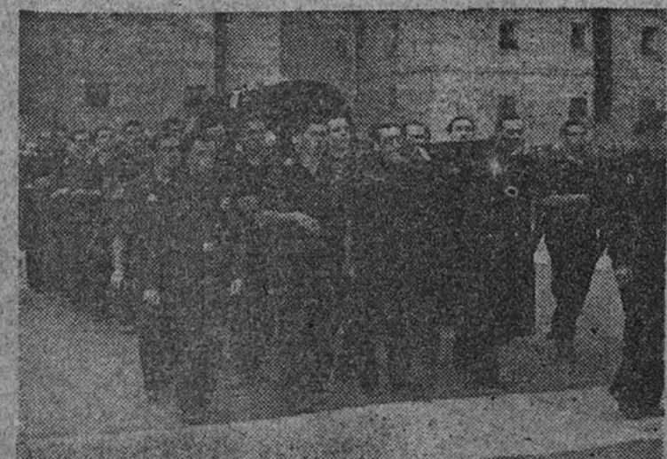
A hombros de miembros de la Junta Política, el féretro llega al inmenso recinto del Monasterio