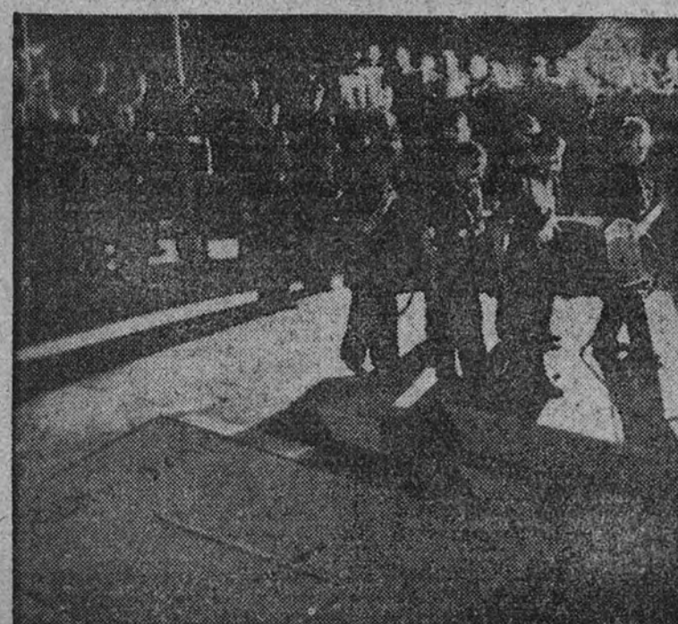
El atadú que contiene los gloriosos restos llega al centro de la basílica escorialense, donde ha de reposar su eterno sueño.