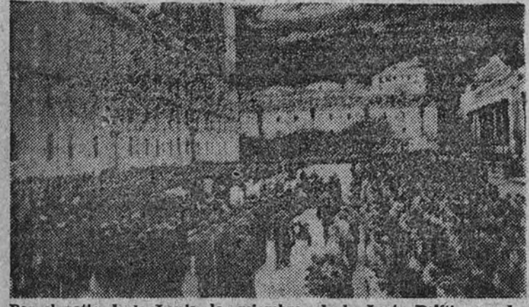
Por el patio de la Lonja, los miembros de la Junta Política conducen el féretro hacia el interior de la basílica.