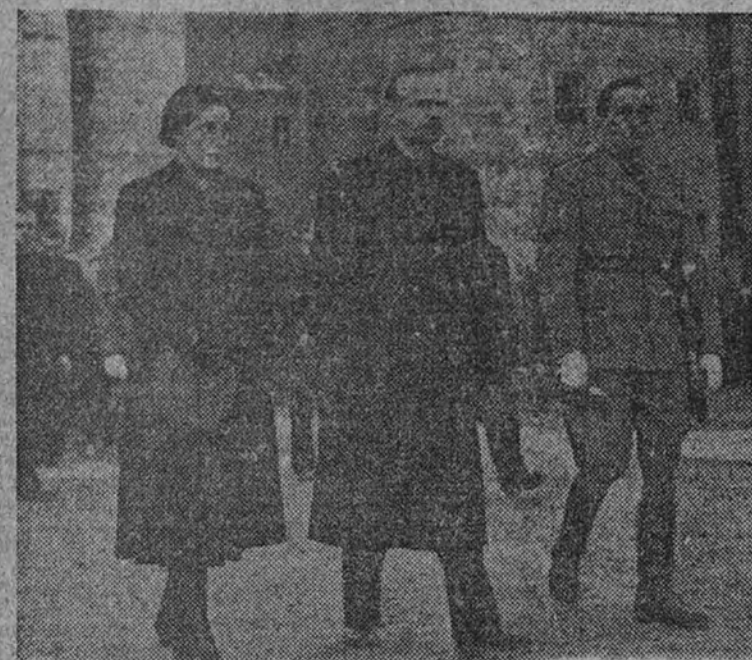
El presidente de la Junta Política, Sr. Serrano Suñer; Pilar Primo de Rivera y el secretario del Partido