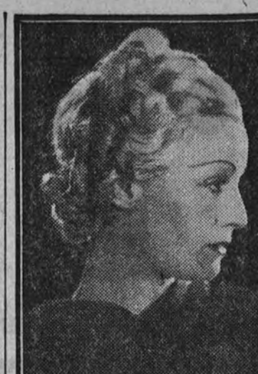
Lilian Harvey, cuya destacada actuación en "La ballarina vienesa" ha constituido un extraordinario éxito.

CONGA-BAR.—En los bajos del Cine Progreso. No la dude; pasará una noche inolvidable.