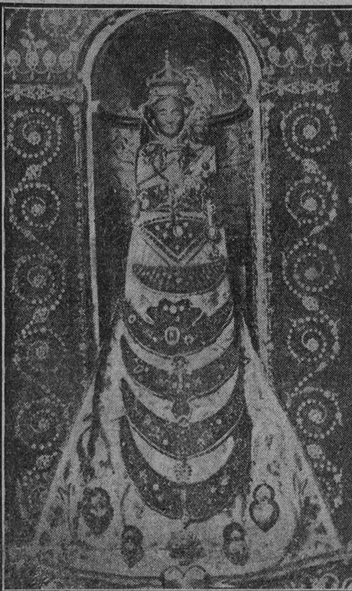
La imagen de Nuestra Señora de Loreto.

El Ejército del Aire italiano regala al español una imagen de Nuestra Señora de Loreto