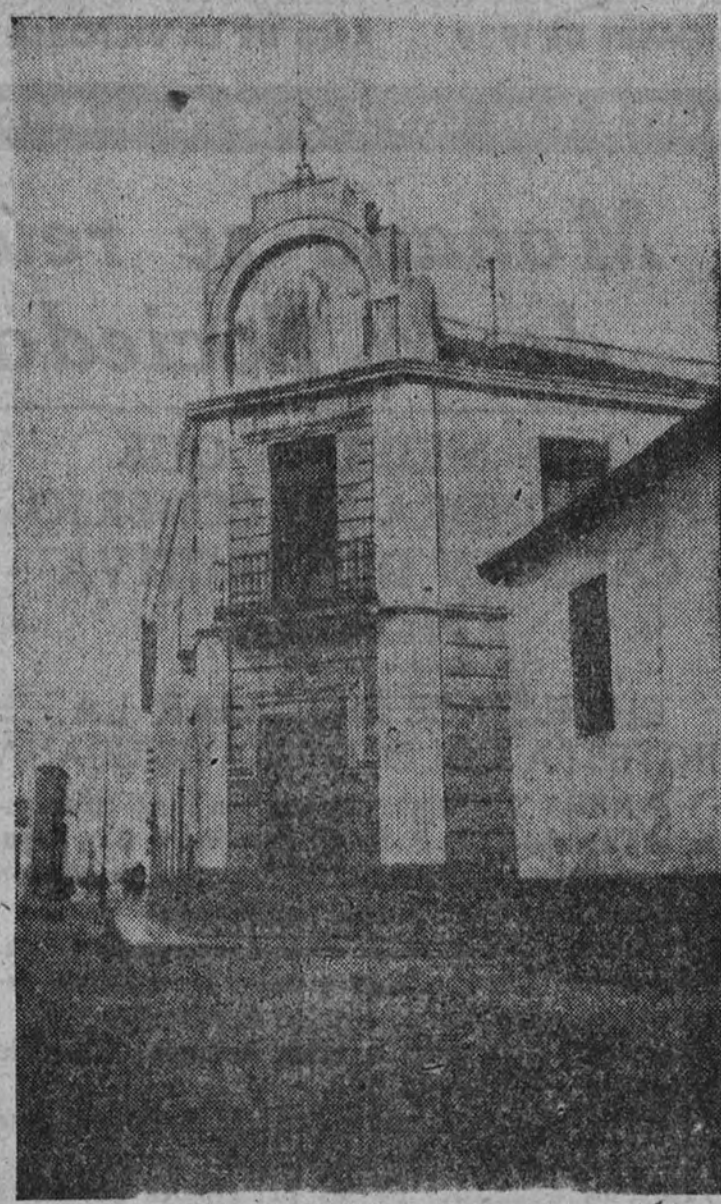
Fachada del edificio de la Cooperativa

No podía faltar en nuestro viaje por la industria y próspera región manchega una visita al importantísimo pueblo de Alcazar de San Juan, donde tanto se nos ponderó "La Equidad", Sociedad Cooperativa de Consumidores allí existente, que, sin poder sustraernos a la curiosidad que tantos elogios nos inspiraba, quisimos conocerla para dedicarle una información si la consideráramos merecedora de ello.