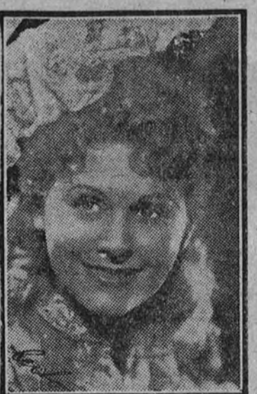
Marika Rokk, estrella de la Ufa, con el estreno del gran film “Gasparone”.

PROGRESO LUNES, 11 QUINTA SEMANA Suspiros de España El mayor éxito cómico del año MIGUEL LIGERO Dirección: BENITO PEROJO