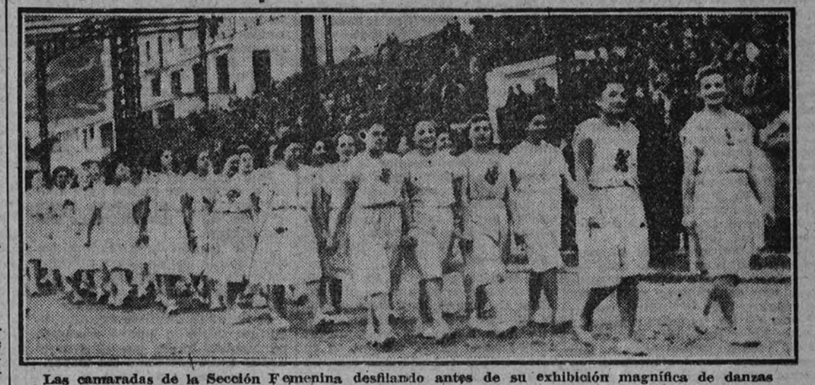
Las camaradas de la Sección Femenina desfilando antes de su exhibición magnífica de danzas rítmicas.