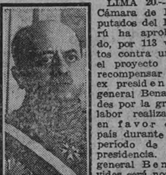
Benavides, mariscal del Ejército peruano.