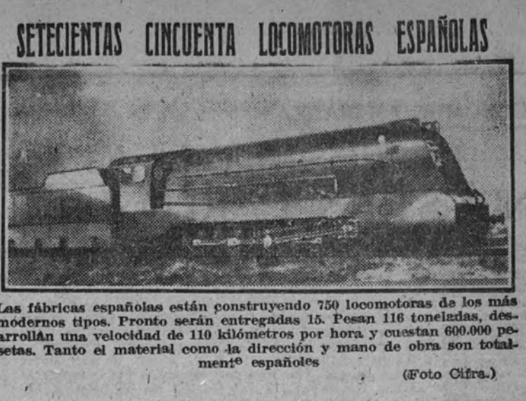
Las fábricas españolas están construyendo 750 locomotoras de los más modernos tipos. Pronto serán entregadas 15. Pesan 116 toneladas, desarrollan una velocidad de 110 kilómetros por hora y cuestan 600.000 pesetas. Tanto el material como la dirección y mano de obra son totalmente españoles.