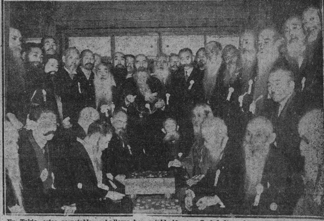
En Tokio, estos respetables caballeros han establecido una Sociedad con importante fin de estimular el crecimiento de la barba y de los bigotes. Actualmente, más de cien miembros de la institución se han reunido para comprobar su continua resistencia ante la navaja de afeitar y el jabón. Cien caballeros barbudos, cien, posan ante el objetivo fotográfico, contentos y felices de sus malucos.