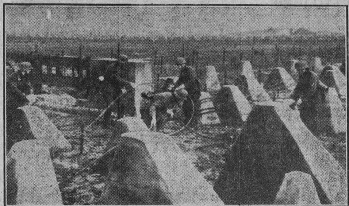
Los soldados alemanes colocan las alambradas entre las defensas anticarro de la línea Sigfrido, prolongada hasta el mar del Norte.

800 KILOMETROS DE DEFENSA Y MAS DE 22.000 REFUGIOS