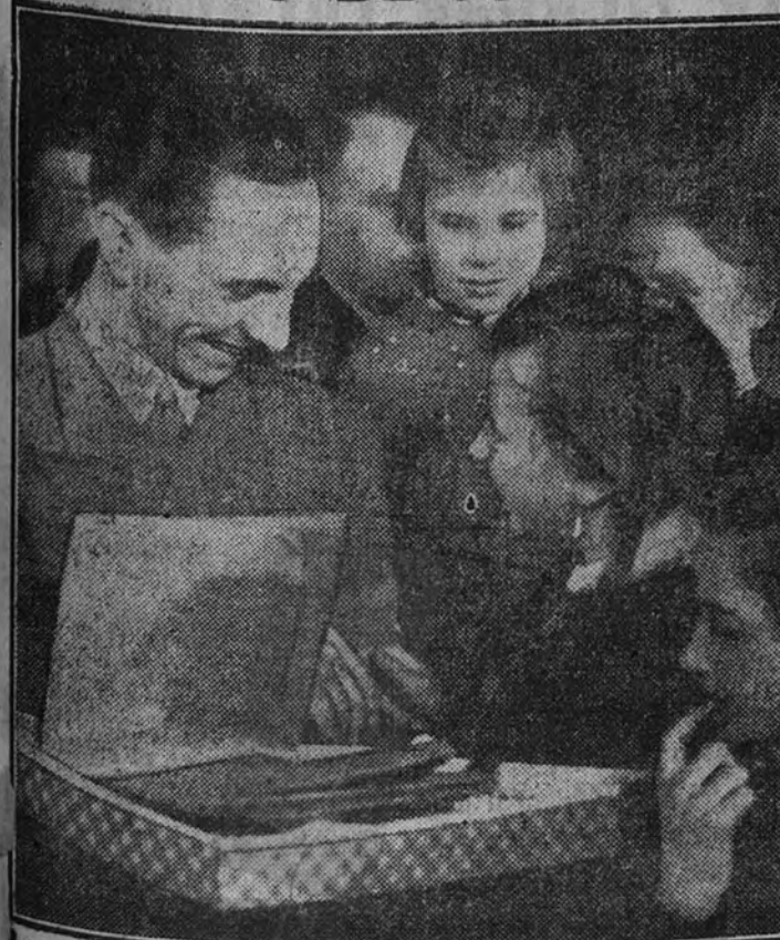
Ministro de Propaganda, doctor Goebbels, reparte regalos a los niños alemanes, con motivo de las fiestas de Navidad.