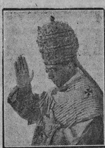
Su Santidad Pío XII

El cortejo renueva su marcha hasta llegar frente a la tribuna ocupada por el gobernador de Roma y por los representantes de los distritos de la Ciudad Eterna. El gobernador general, príncipe Giacomo Borghese, lee un documento de salutación al Sumo Pontífice, en nombre de la ciudad. Su Santidad contesta con breves palabras, en las que agradece el cordial recibimiento. Los ocupantes de la tribuna se unen al cortejo.