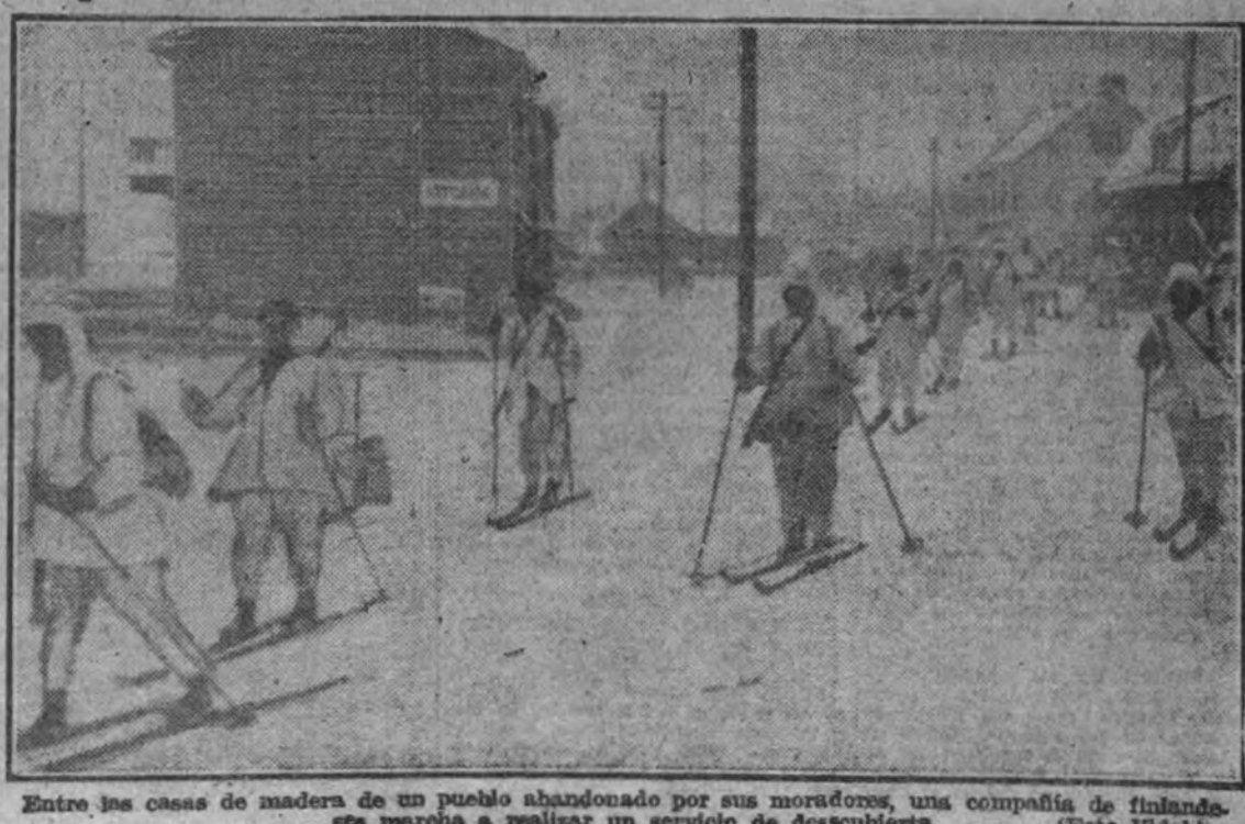
Entre las casas de madera de un pueblo abandonado por sus moradores, una compañía de finlandeses marcha a realizar un servicio de descubierta.