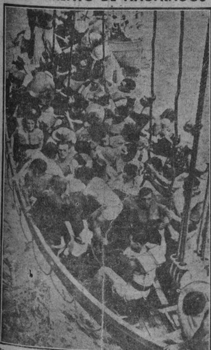
Poco antes de que el barco despareciera se ha hecho febrilmente la última maniobra de salvamento. Las lanchas descendieron como pesadas aviones a colonizar el chubasco salvaje, ocuparon apresuradamente sus puestos, ante un destino incierto. La mina submarina o el imperativo del buque de guerra enemigo han terminado su aventura; pero estos salvados y salvadores se encuentran en la compleja ahora dentro a un más sin fin.