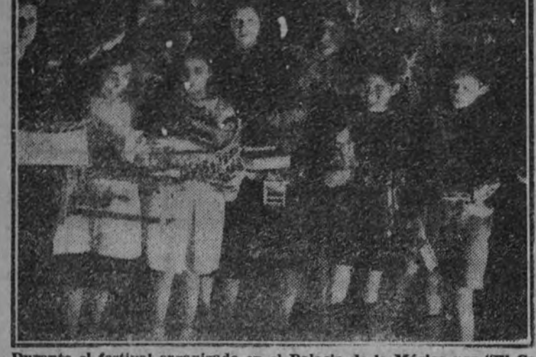
Durante el festival organizado en el Palacio de la Música por "El Centro de la Parálisis" la Falcange Femenina ha repartido juguetes a los niños de las escuelas municipales.