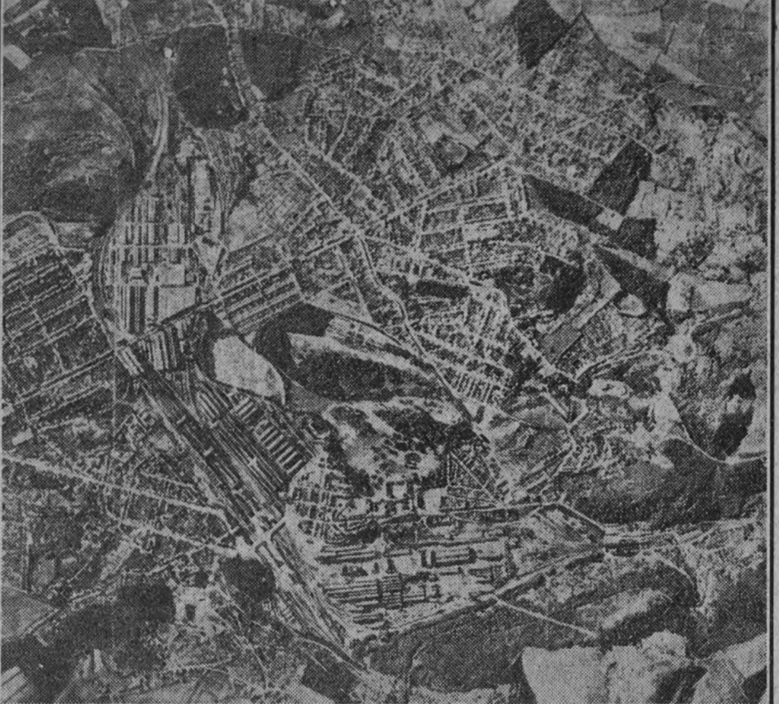
Desde un avión alemán de bombardeo ha sido tomada esta fotografía de las grandes fábricas francesas de Le Creusot.

La aviación alemana sobre las fábricas francesas