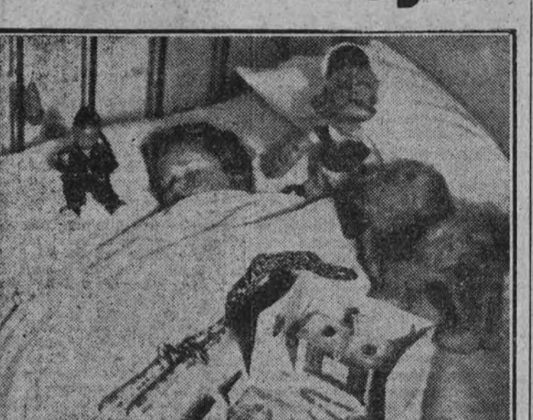
El día 6, al despertar, encontrará el niño sobre la almohada, hechos realidad por arte y gracia de su fantasía, todos sus sueños pasados.

En la Delegación de Cultura de la Sección Femenina de Madrid se ha inaugurado la exposición de canastillas de la Sección Femenina de Madrid.