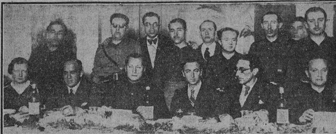
Una comedia histórica. La Falange rinde homenaje a Eugenio Montes en el salón de un café madrileño, apretado de camisas azules, José Antonio y Sánchez Mazas, Ruiz de Alda y Fernández Cuesta, se sientan junto al escritor. Son los días difíciles de las primeras batallas, y los pistoleros del marxismo cercan el local donde se celebra. Nuestra primera línea abre paso mandada por José Antonio, y la Falange continúa su lucha, dura y empeñadamente, por una España mejor.