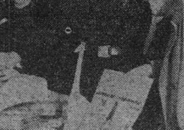
El reparto de juguetes en la Delegación de O. J. de la Universidad.

Figuraban después, en el cortejo de los Reyes Magos, los cuerpos de baile de las Organizaciones Juveniles de Las Palmas, ataviadas las muchachas con trajes