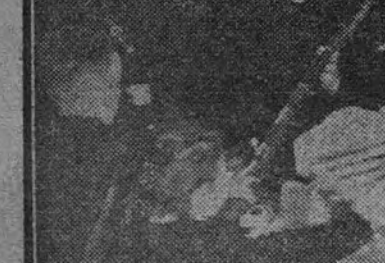
El reparto de juguetes en la Delegación de O. J. de la Universidad.

El desfile de la cabalgata de Reyes lucía de cuantos por su capital han desfilado. Un público inmenso, entre el que,