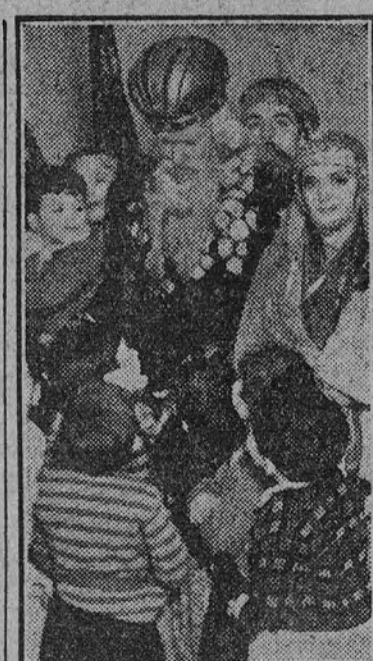
El Rey Baltasar con los niños de la guardería infantil de Auxilio Social.

naturalmente, predominaban los niños esperaban desde media tarde alineados a lo largo de todas las calles por donde había de pasar la comitiva. Comenzó a llover, pero la multitud siguió esperando, segura de que no saldría defraudada.