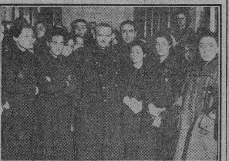
El presidente de la Junta Política, camarada Serrano Suñer, con el Consejo Nacional de la Sección Femenina, en su visita al primer Centro de la Falange.