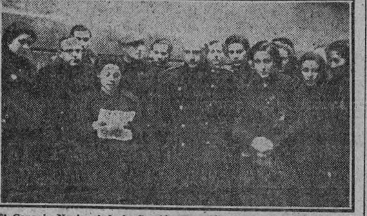
El Consejo Nacional de la Sección Femenina, con el presidente de la Junta Política, en la calle de Augusto Figueroa, oyendo la evocación de un caído en dicho lugar, que lee una camarada.

DESDE LA ESQUINA EN QUE CAYO UNO DE TANTOS FALANGISTAS HASTA EL PROPIO DESPACHO DE JOSE ANTONIO