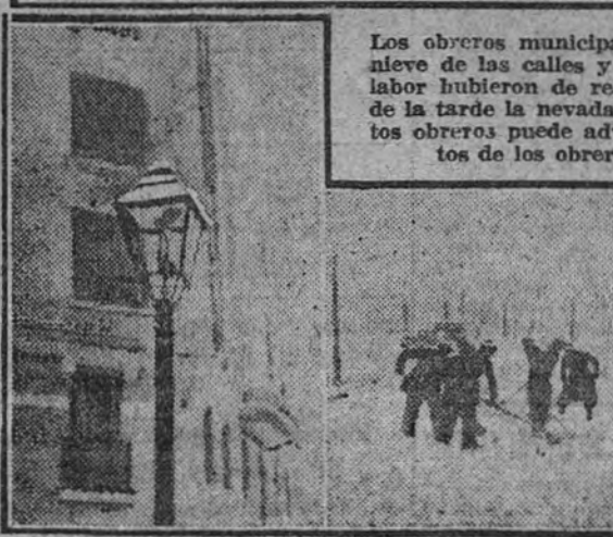
Los obreros municipales de Limpieza, dedicados a la labor de quitar la nieve de las calles y plazas madrileñas durante la mañana de ayer. Esta labor hubieron de repetirla algunas veces, pues hasta las primeras horas de la tarde la nevada fue incesante. En las horas y en los hombres de estos obreros puede advertirse la nieve, que, pese a los obligados movimientos de los obreros en su tarea, iba cuajando a medida que caía.