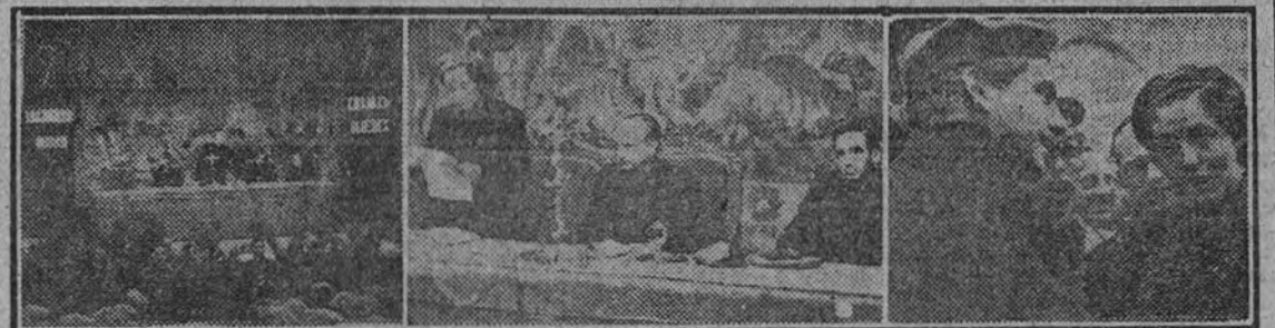
El presidente de la Junta Política al comenzar su importante discurso.—Pilar Primo de Rivera lee las conclusiones.—El Sr. Serrano Suñer conversando con Pilar Primo de Rivera durante el recorrido del Alcázar