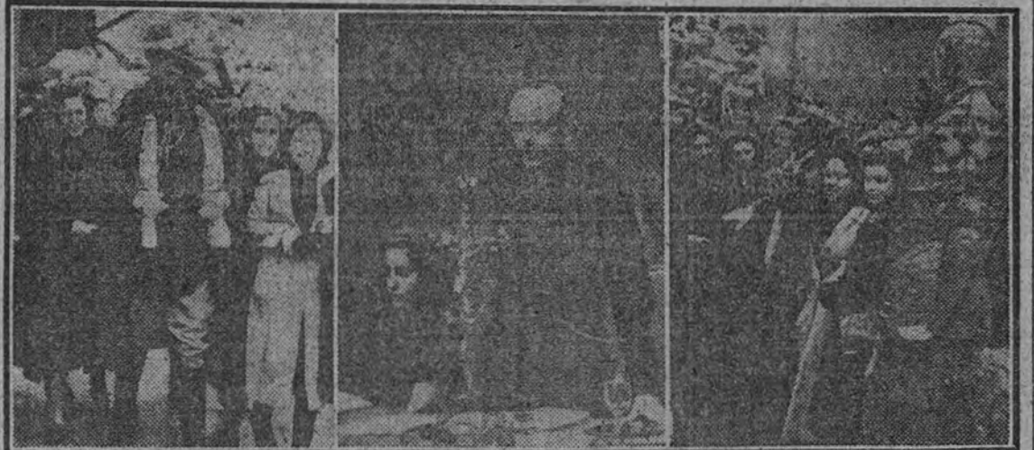
Pilar Primo de Rivera y el general Moscardó durante la visita al Alcázar.—El presidente de la Junta Política, pronunciando su discurso.—El general Moscardó recordando algunos hechos heroicos, durante el emocionante recorrido