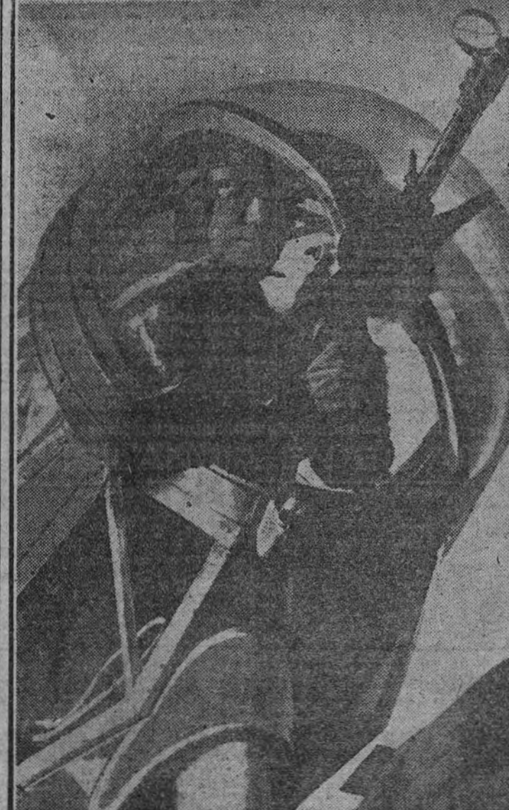
He aquí la torreta del ametrallador de un avión alemán. Desde su puesto puede vigilar perfectamente todo ataque enemigo y contestar a su fuego, impidiendo que el cruz se convierta en un adversario excesivamente peligroso.

ARITA PIDE QUE INGLATERRA NO REPITA LA "ACCION DESAGRADABLE"