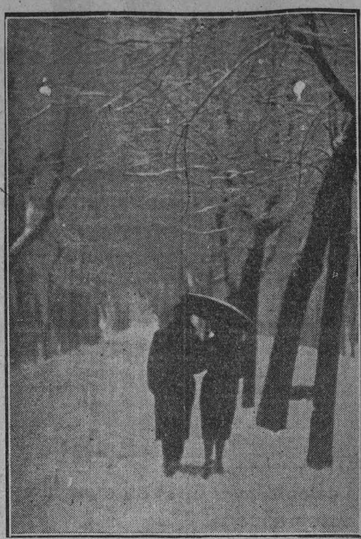
Ayer los empleados municipales han advertido con asombro que un equipo mágico se les ha adelantado en la difícil misión de derretir la nieve

Se ruega a todos los industriales de la rama de la lana que se adhieran al Sindicato de Industrias Químicas, para mejorar sus condiciones laborales.