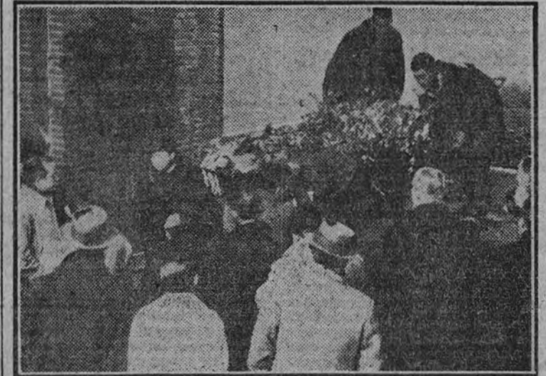
Condición al cementerio de uno de los féretros.

Posteriormente fueron trasladados al cementerio de los féretros.