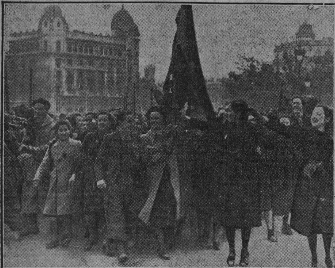
A las cinco de la tarde del día 26 toda Barcelona estaba ocupada, y la población entera invadió las calles, aclamando al Ejército. Con una improvisada bandera, esta alegre manifestación de mujeres y muchachos recorrió una de las principales calles.

El puente de Molins quisieron hacerlo los marxistas barrera entre dos mundos y dos civilizaciones. El río pudo ser obstáculo, en beneficio de sus propósitos; pero les faltó la decisión, y tras una voladura, fallida, de los pilares centrales, el quinto tabor de Melilla, protegido por el fuego de las "Flacs", se lanzó a la aventura, seguros del triunfo, no tardaron en conseguir.