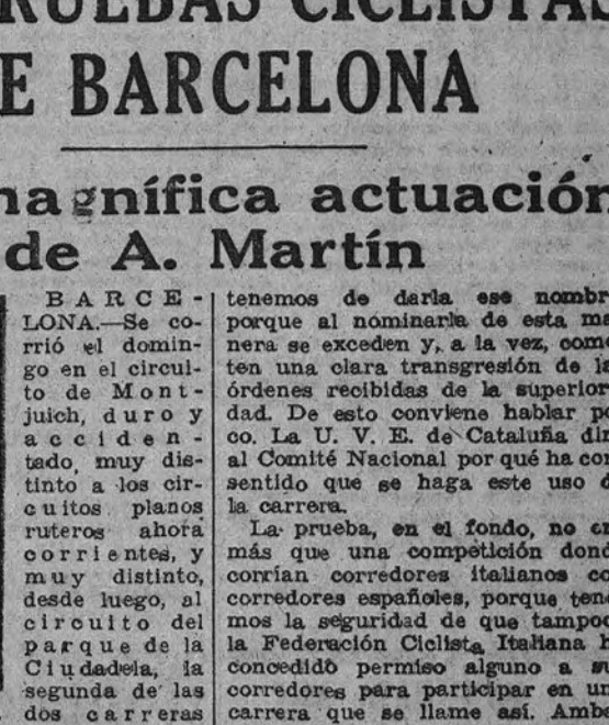
que, a base de preparar los pro-