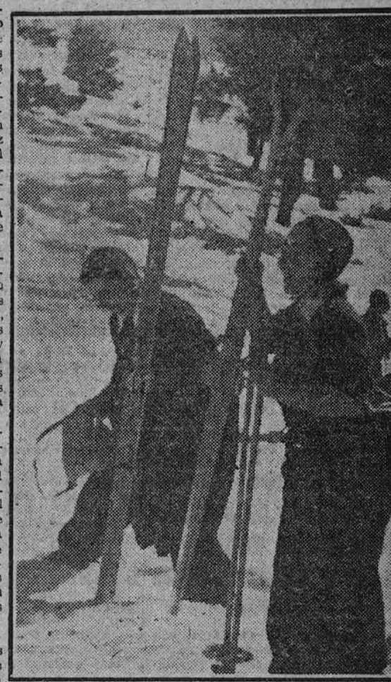
omtingo al no po- rto hasta después Delegación de Esquí de F. E. T. de las J. O. N. S. entre los equ