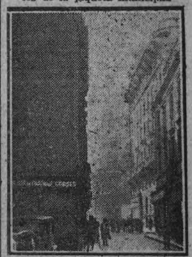
El "tapón" de la calle del Clavel tampoco seguirá mucho tiempo entorpeciendo la alineación de esta vía.