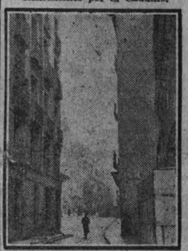
Estos decrepitos edificios, triste contraste con la avenida de José Antonio, serán demolidos por el Ayuntamiento.