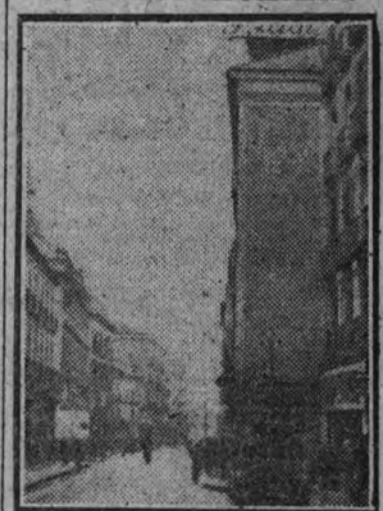
El célebre "tapón" de la calle del Arenal, que el Ayuntamiento derribará acogidos a la ley de Expropiación Forzosa, promulgada recientemente por el Caudillo.

Se cree que el primer objeto que persiguen los delegados es el de asegurar la resurgencia del comercio interbalcánico en proporciones, por lo menos, iguales a las que tenía en tiempo de paz. Sin embargo, los Estados vecinos de Alemania no desean tomar ninguna medida que pueda dar motivos de queja al Reich, Yugoslavia y Rumania desean que después de la actual conferencia se concluya una serie de tratados bilaterales de comercio entre todos los Estados balcánicos. A este respecto se sabe que hoy ha llegado a Belgrado un grupo de expertos económicos búlgaros, que celebrarán conversaciones con los yugoslavos sobre temas comerciales. (Efe.)