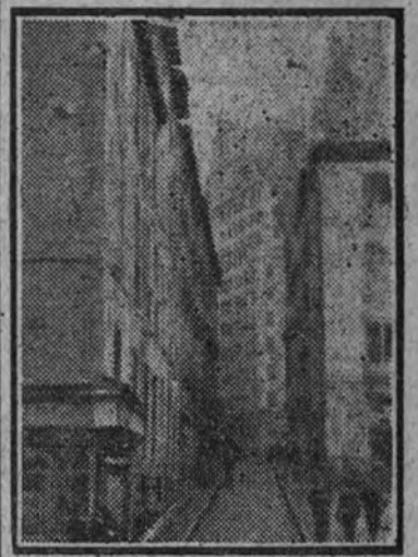
Este cajón de la calle de Tres Cruces, sentirá también los años efectos de la piqueta municipal.