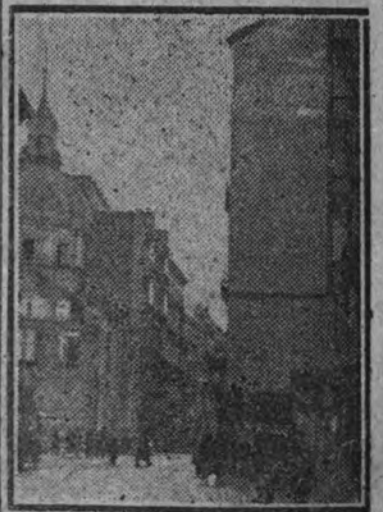
Otro "tapón" que también desaparecerá: el de la calle de Atocha.