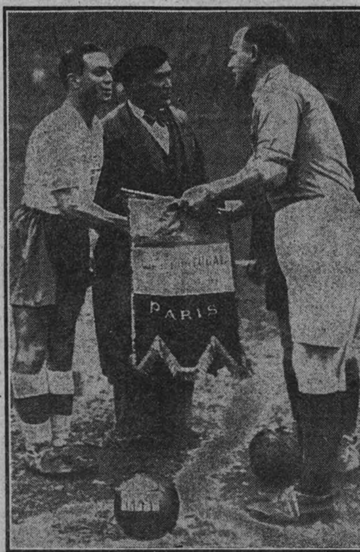
Los capitanes de los equipos de Francia y Portugal se cambian saludos y banderines antes de comenzar el encuentro.

¿Va a suceder lo mismo frente a Inglaterra? Seguramente, no. Por eso los críticos aconsejan al equipo francés que se entrene bien estos días, con objeto de que procure evitar aquel espectáculo de segunda categoría de los jugadores, lamentándose de calamidades, prueba evidente de que no se encuentran a punto. El problema se agrava considerando que el equipo que se enfrentará a los franceses, "El Ejército de Francia", procedente del otro lado del Canal, es un equipo, si no el mejor de Inglaterra, por lo menos de muy buena calidad, y con la ventaja sobre los franceses de haber estado jugando toda la semana. Los críticos parciales dicen que el equipo francés de "nombres" se va a enfrentar a un equipo de "profesionalistas", a un equipo en plena forma. Precisamente este equipo