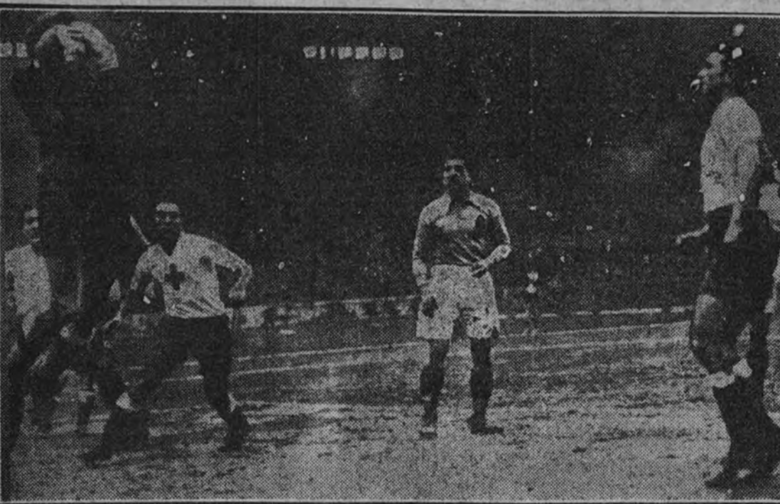
DEL PARTIDO FRANCIA-PORTUGAL.—El portero galo defendió arduamente su puerta en la segunda mitad, en que los portugueses fueron más agresivos.