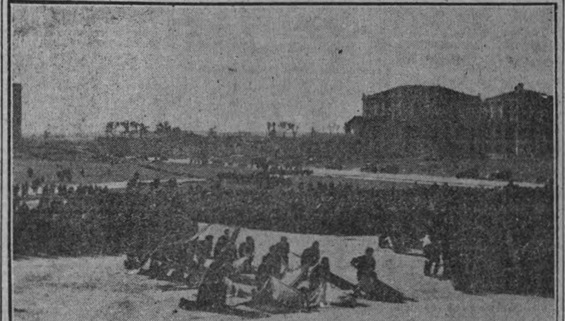
Aspecto que ofrecía la plaza de la Facultad de Medicina en el solemne momento de alzar.