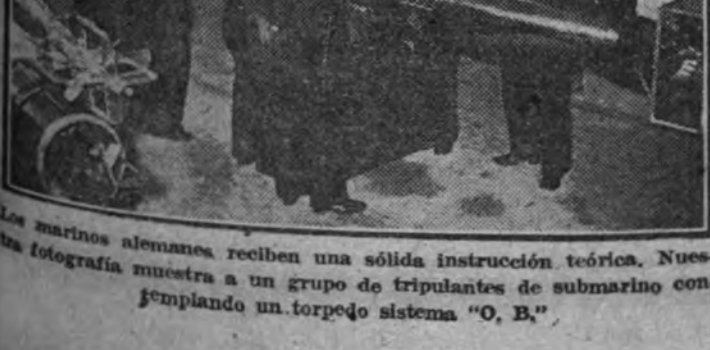
Los marineros alemanes reciben una sólida instrucción teórica. Nueva fotografía muestra a un grupo de tripulantes de submarino contemplando un torpedero sistema "O. B."