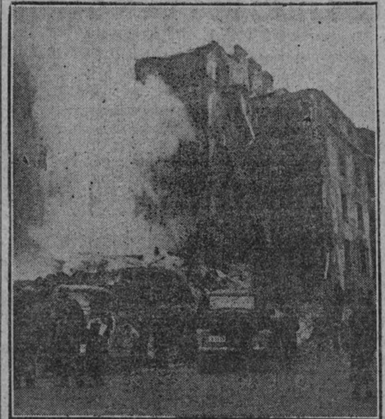
La aviación soviética bombardea sin piedad los núcleos civiles de Finlandia. He aquí el aspecto de un grupo de casas después de la incursión de los bombarderos rojos. (Foto ARRIBA.)