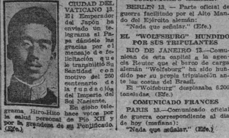
El Emperador del Japon contesta al telegrama de Pio XII.

Hace votos por la grandezadel Pontificado