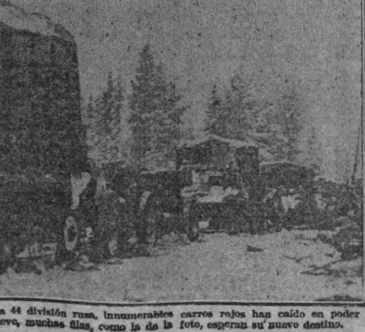
Después de la derrota sufrida por la 44 división rusa, innumerables carros rojos han caído en poder de los finlandeses. Sobre la nieve, muchas filas, como la de la foto, esperan su nuevo destino.

ERA LA QUE DESFILABA EN LA PLAZA ROJA DE MOSCU