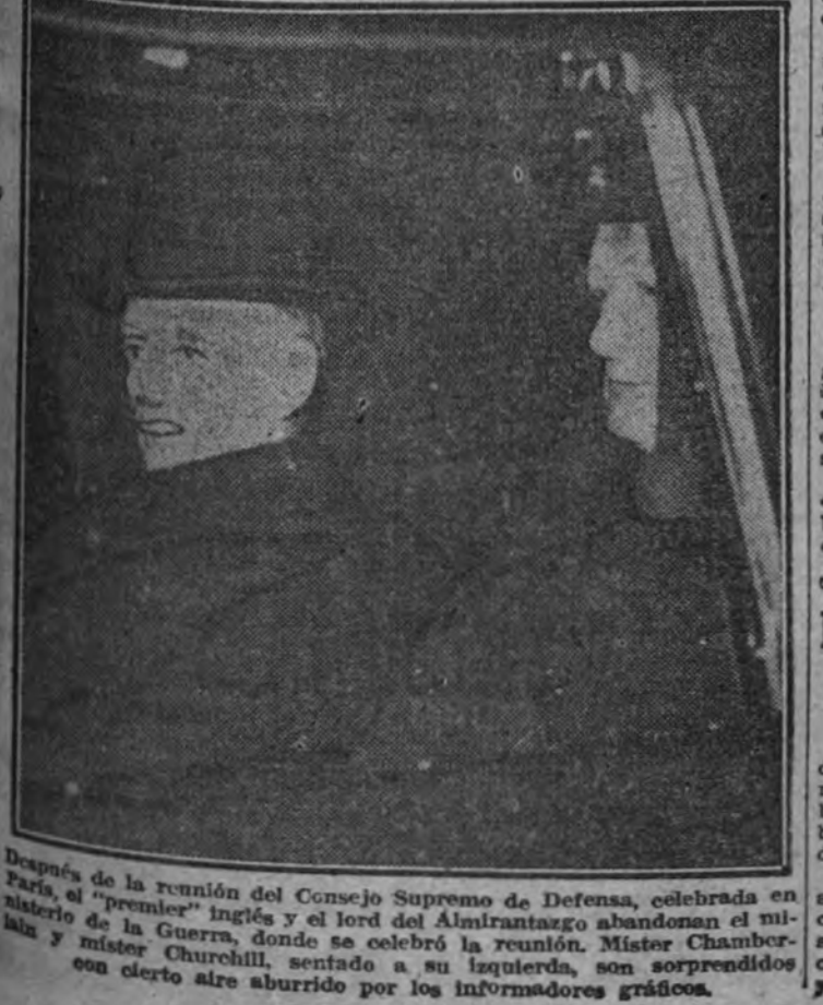
Después de la reunión del Consejo Supremo de Defensa, celebrada en París, el "premier" inglés y el lord del Almirantazgo abandonan el Ministerio de la Guerra, donde se celebró la reunión. Mister Chamberlain y Mister Churchill, sentados a su izquierda, son sorprendidos con cierto aire aburrido por los informadores gráficos.