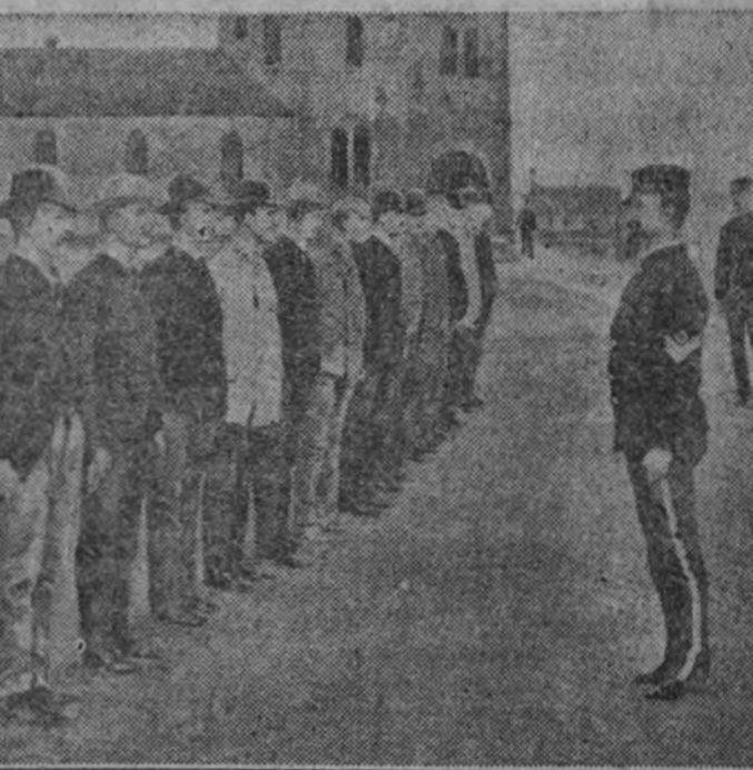
Instrucción de reclutas de Artillería en el fuerte Slocum (Long Island Sound).

"En 1898 los yanquis declararon la guerra a España. Las naciones europeas prepararon una nota en la que amenazaban con intervenir