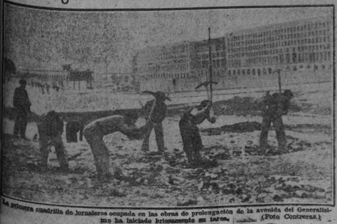
La primera cuadrilla de jornaleros ocupada en las obras de prolongación de la avenida del Generalísimo ha iniciado briosamente su tarea.