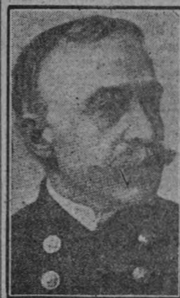
El comodoro Dewey

Cuando, al fin, Dewey zarpó para atacar la bahía de Manila, la escuadra alemana marchó tras la flota yanqui; pero en ese momento Chichester colocó sus buques en línea e impidió el paso de la escuadra alemana cruzándose en su camino. Quedaban, pues, dos fuertes escuadras contra una sola, y los buques de guerra alemanes disminuyeron su marcha, hicieron alto y volvieron atrás."