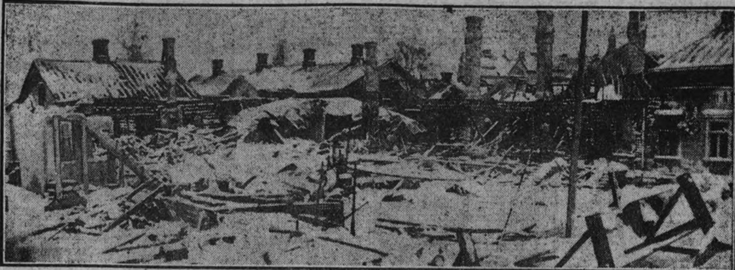
La aviación soviética ha pasado por un humilde pueblito finlandés, sin objetivo militar alguno y sin defensas antiaéreas. Las pobres casas han sido pulverizadas por la metralla. Escenas demasiado conocidas en tantos pueblos de España, que conocieron el salvajismo de los pilotos rojos.