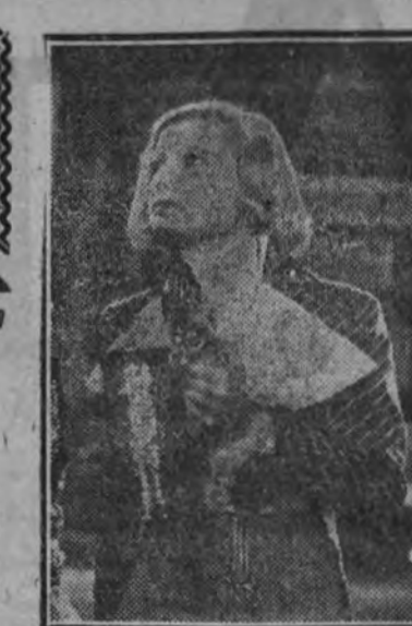
Lillian Harvey, creadora de la comedia musical "Caprichio", cuyo estreno anuncia el Imperial