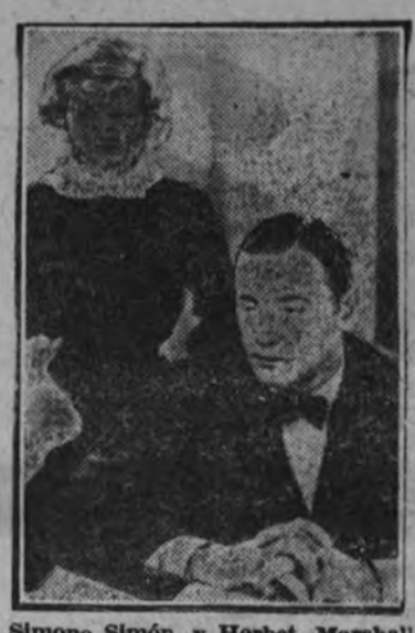
Simone Simón y Herbert Marshall en una escena de "Gris dormido", que anuncia el cine Salamanka

Un programa indudablemente tan interesante como original.