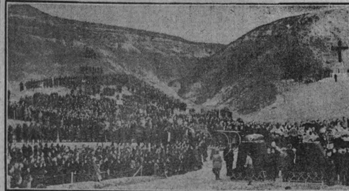
La muchedumbre que prestó homenaje el domingo pasado a los mártires de Paracuellos.

LA CEREMONIA SE EFECTUO EL DOMINGO, RINDIENDOSE HONORES DE CAPITAN GENERAL