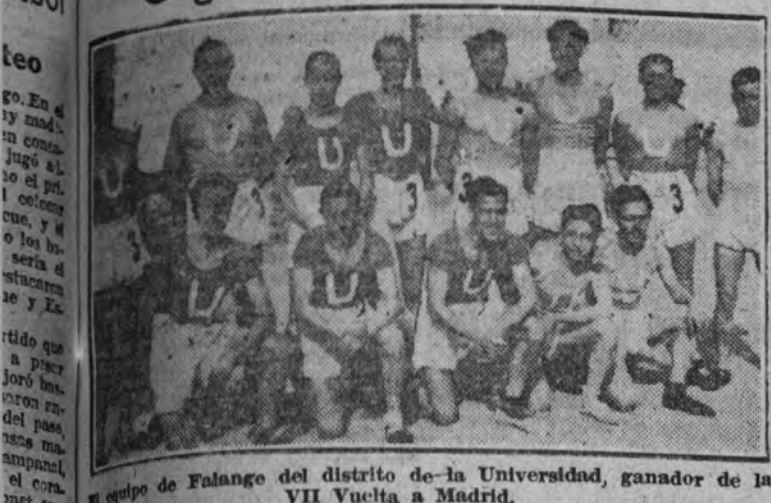
El equipo de Falange de la Universidad, ganador de la VII Vuelta a Madrid.

El nacimiento, después de la guerra, de la clásica prueba de relevos de la temporada atlética madrileña, ha tenido lugar con un espíritu de popularidad, insuperable, desde su creación por parte de las organizaciones de la Falange deportiva.