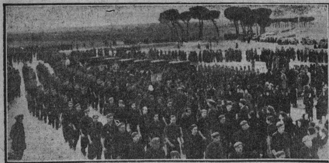
Las milicias de F. E. T. y de las J. O. N. S. desfilando.

(Viene de primera página.) llevaron hasta el cementerio las representaciones oficiales.