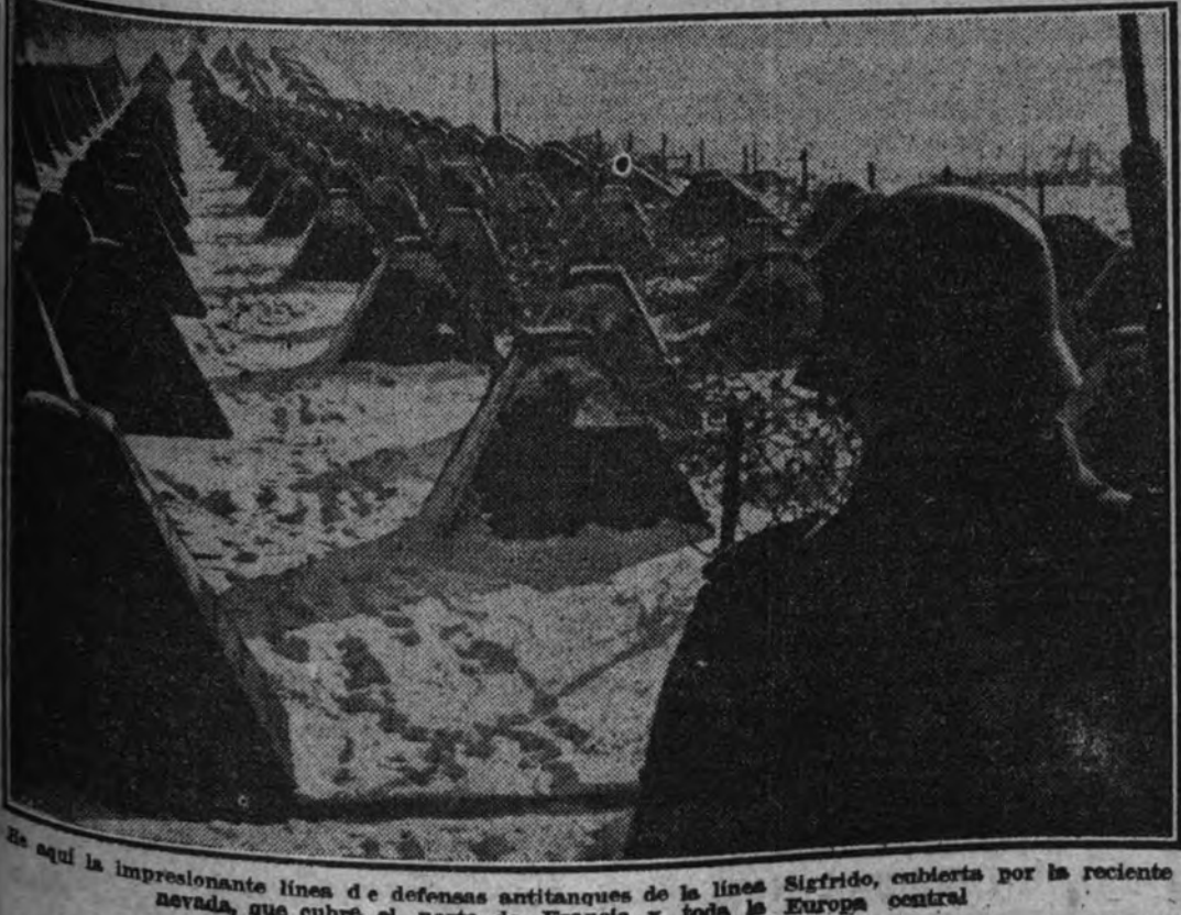
La impresionante línea de defensas antitanques de la línea Sigfrido, cubierta por la reciente nevada, que cubre el norte de Francia y toda la Europa central.