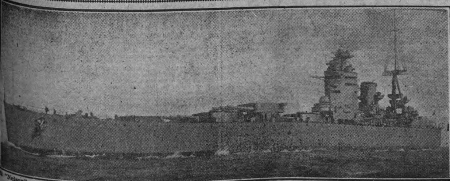
"Nelson", una de las mejores unidades de la flota inglesa de combate, ha sido averiado por una mina magnética hace meses. El hecho ha sido confirmado por el Sr. Churchill en su discurso de ayer.

Este buque, que desplaza 34.000 toneladas, está armado con nueve cañones de 16 pulgadas.