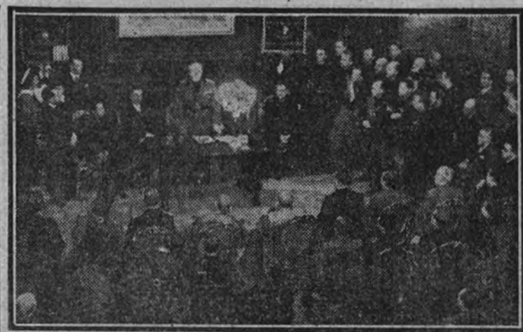
El presidente de la Academia de Italia, Luigi Federzoni, pronunciando su discurso en la inauguración del Instituto de Cultura Italiana.

A las seis de la tarde llegó el presidente de la Real Academia