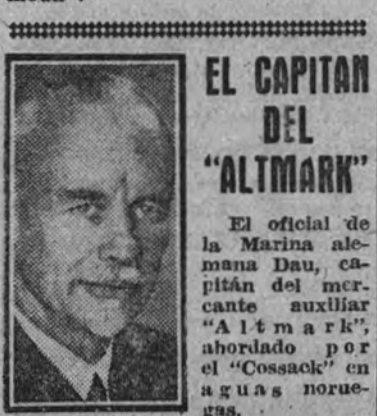
EL CAPITAN DEL "SIMOUN"

PARIS 27.—La agencia Havas da los siguientes detalles sobre el hundimiento de un submarino alemán por el torpedero francés "Simoun":