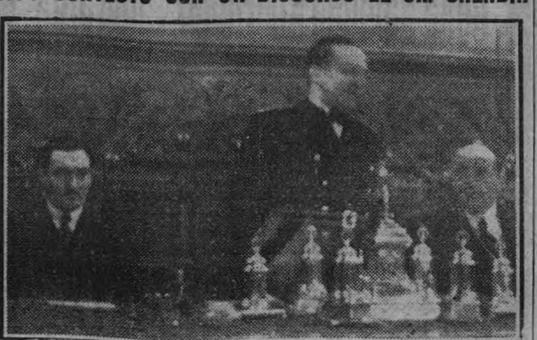
El subsecretario de Hacienda pronunciando su discurso en la inauguración de la Bolsa. A su derecha, el subsecretario de Prensa y Propaganda, camada Alfaro

(La información completa del acto, en la Sección "Economía y Finanzas", segunda página.)