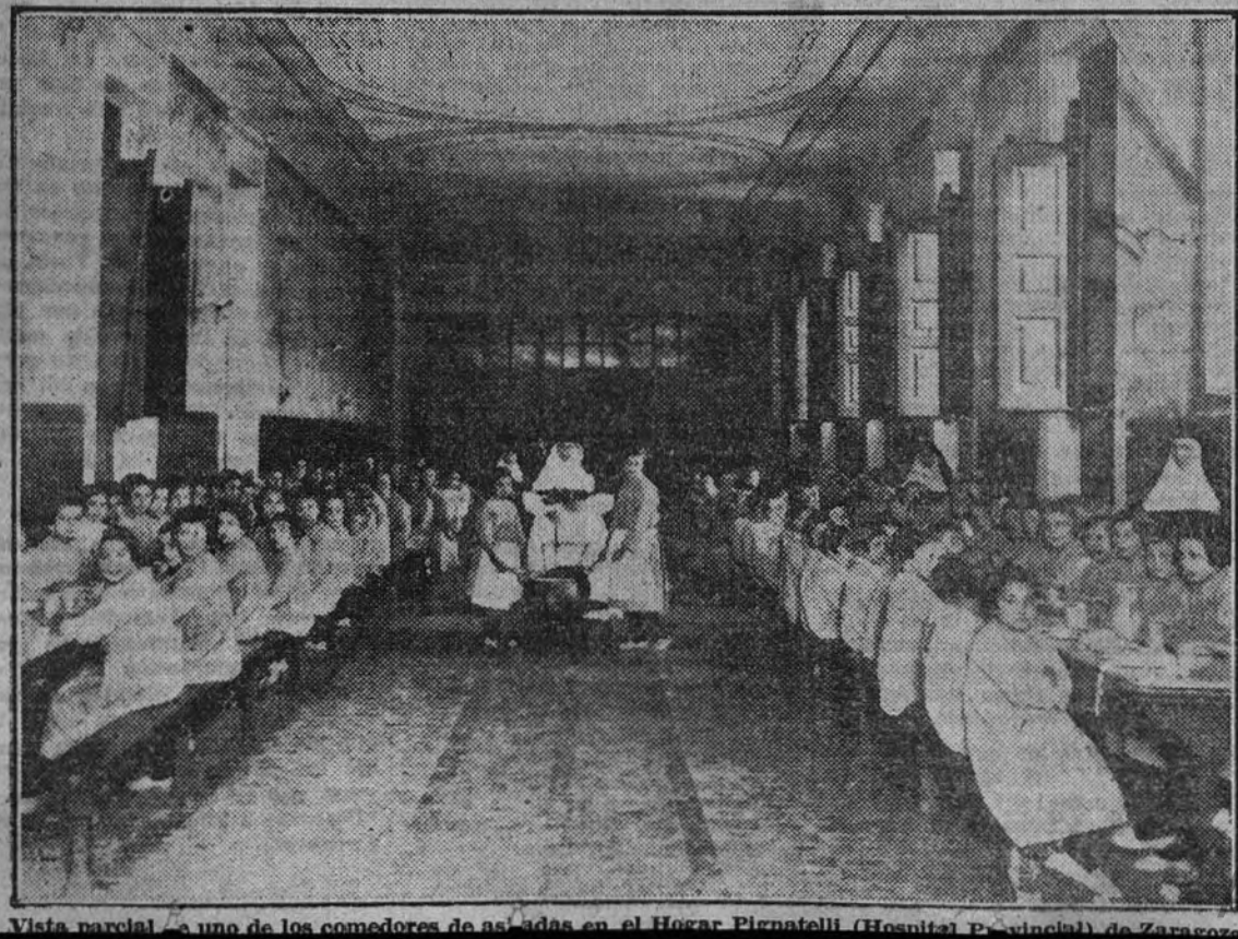
Vista parcial de uno de los comedores de asilados en el Hogar Pignatelli (Hospicio Provincial) de Zaragoza

Palabras emocionadas que resuenan en la noble tierra aragonesa a resonar con optimismo por los ámbitos de la Patria, acude a aquel recuerdo.