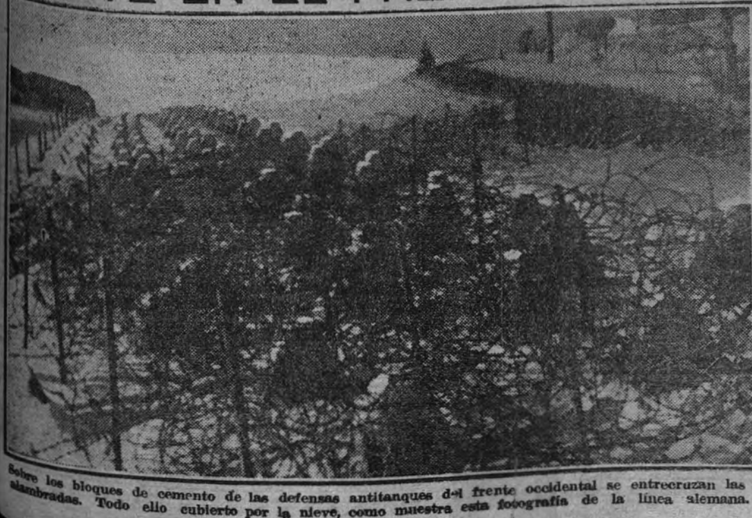
Se ven los bloques de cemento de las defensas antitanques del frente occidental se entrecruzan las alambradas. Todo ello cubierto por la nieve, como muestra esta fotografía de la línea alemana.