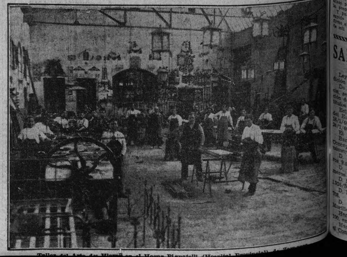
Talles del Arte de Huesca. Hogar Pignatelli (Hospicio Provincial) de Zaragoza