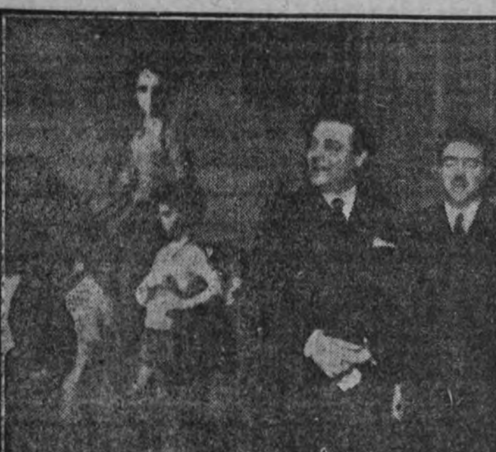
En el salón de fiestas de la Asociación de la Prensa se inauguró ayer tarde la exposición de retratos al óleo del pintor Agustín Segura.