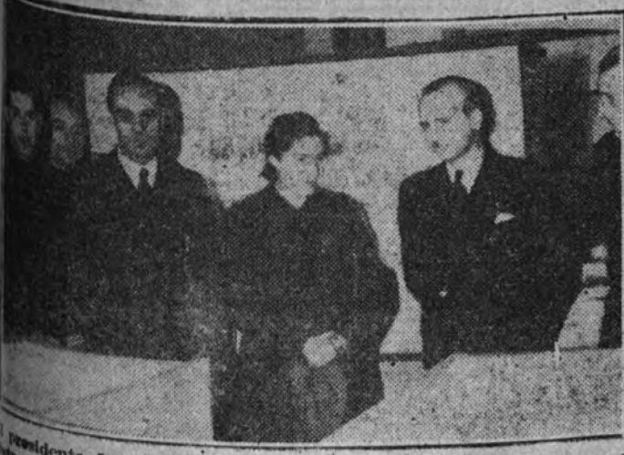
Presidente de la Junta Política, D. Ramón Serrano Suñer; el ministro de Educación Nacional, D. Juan Vázquez de Mella; el delegado nacional de la Sección Femenina, D. María de la Cruz; y el delegado nacional de la Sección de Cultura, D. José Antonio. En la celda que en la prisión de Alicante ocupó José Antonio.

Que el castigo de esta ocasión perdida por Europa contra su enemigo común recaiga en buena hora sobre los culpables que señale la Historia.