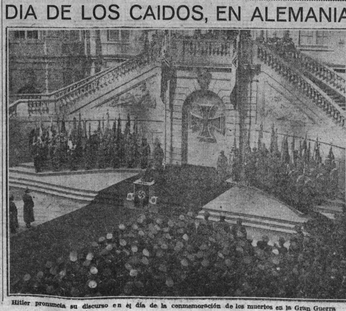
Hitler pronuncia su discurso en el día de la conmemoración de los muertos en la Gran Guerra

Antes de ser adjudicadas las obras del pantano del Generalísimo, que convertirá en regado una extensa comarca valenciana; ayer se terminan parte de las obras de saneamiento de El Fudri y se rescatan para los campesinos granadinos varios miles de hectáreas de tierra que no producían. Hoy comienzan las obras del pantano de Cubillas, también de Granada, que permitirá el asentamiento de 70.000 colonos en fértiles tierras. Esto son realidades, realidades auténticas e incontrovertibles, en primeras piedras y sin palustres de plata.