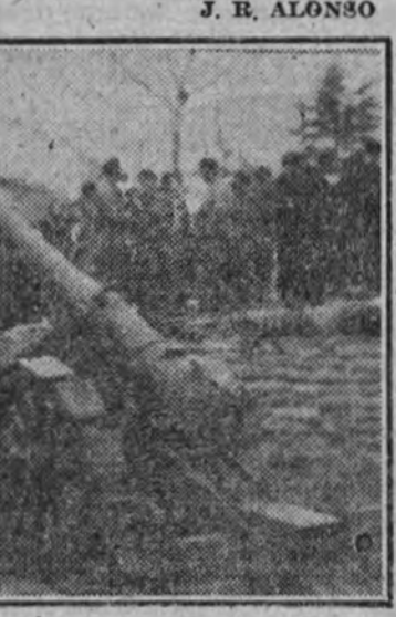
Las piezas rojas, que antes lanzaban su metralla sobre las líneas nacionales, se convirtieron en la mañana del 28 de marzo en lugar de visita para los curiosos madrileños.

hambrientas. La camisa azul y la bolina roja cruzaba por vez primera las defensas de lo que iba a ser "la tumba del fascio". Y a dos pasos está la Gran Vía. En aquellos momentos, unos falangistas desconectan la radio, desde la cual pretendía Besteiro realizar la última farsa de su lealtad repudiada. Madrid era ya de la Falange desde horas antes. Las primeras calles hierven de gallardetes y camisas azules, que, formados en banderas, garantizan el orden en la ciudad conquistada. ¡Díez y diez minutos de la mañana! Plaza del Callao, Madrid, por bocas y radios, lanzaba sus primeros "toros". Sobre la ciudad conquistada, sobre España sobrepujada por la emoción y el asombro, rodaba, flameando con alegría de bandera, nuestro "ARRIBA ES. FANSA". J. R. ALONSO