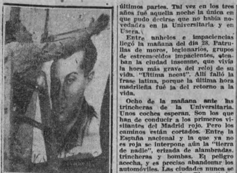
Los primeros carteles de la propaganda nacional son fijados en los edificios de la capital.