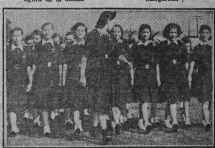
El desfile de las "flechas azules" antes de realizar los ejercicios gimnásticos.