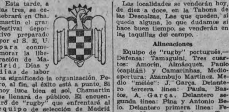
Logo of the S. E. U. (Spanish Falange)

Esta tarde, a las tres, se celebrará en Chamartín el gran festival deportivo organizado por el S. E. U. para conmemorar la liberación de Madrid. La Falange, a través de la organización de la Falange, se encargó de la organización del festival.