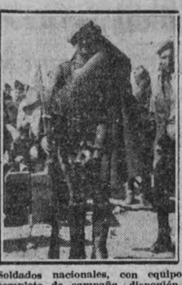
Soldados nacionales, con equipo completo de campaña, disponiéndose para entrar en Madrid.

hambrientas. La camisa azul y la bolina roja cruzaba por vez primera las defensas de lo que iba a ser "la tumba del fascio". Y a dos pasos está la Gran Vía. En aquellos momentos, unos falangistas desconectan la radio, desde la cual pretendía Besteiro realizar la última farsa de su lealtad repudiada. Madrid era ya de la Falange desde horas antes. Las primeras calles hierven de gallardetes y camisas azules, que, formados en banderas, garantizan el orden en la ciudad conquistada. ¡Díez y diez minutos de la mañana! Plaza del Callao, Madrid, por bocas y radios, lanzaba sus primeros "toros". Sobre la ciudad conquistada, sobre España sobrepujada por la emoción y el asombro, rodaba, flameando con alegría de bandera, nuestro "ARRIBA ES. FANSA". J. R. ALONSO