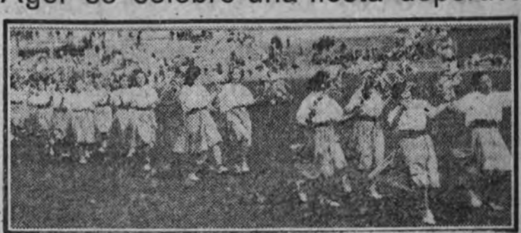
Las muchachas de O. J. durante los ejercicios de baile.

En el campo de Madrid se celebró ayer, a las diez de la mañana, una animadísima fiesta deportiva. Las flechas azules hicieron una magnífica exhibición gimnástica. Representaron después las margaritas un cuento gimnástico, que llamó poderosamente la atención. Las flechas azules jugaron un interesante partido de baloncesto. Cerró el brillantísimo festival deportivo una bellísima exhibición de bailes regionales. Por la tarde, en el Auditorium, se dieron lecciones sobre organización general de una regiduría local de O. J. E., auxiliares locales de Educación Física y funcionamiento de los Departamentos de Cultura y Formación Nacionalista. Hoy, celebración del primer aniversario de la liberación de Madrid, no habrá sesiones especiales de la Semana de Organización Juvenil Feminista.