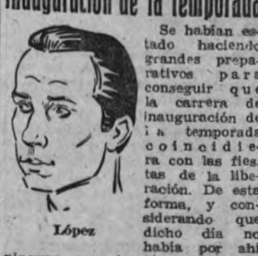
El domingo, la carrera de inauguración de la temporada

Se habían estado haciendo grandes preparativos para conseguir que la carrera de inauguración de la temporada de ciclismo se celebrara en Madrid, y la Falange, a través de la organización de la Falange, se encargó de la organización de la carrera de inauguración de la temporada de ciclismo.