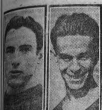
El vencedor, por lo que vemos y oímos, es un muchacho de Castella, por lo que vemos y oímos, es un muchacho de Castella...