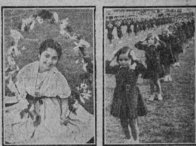
Una muchachita de la O. J. en una figura de la danza. Los ejercicios gimnásticos de las "margaritas".

En el campo de Madrid se celebró ayer, a las diez de la mañana, una animadísima fiesta deportiva. Las flechas azules hicieron una magnífica exhibición gimnástica. Representaron después las margaritas un cuento gimnástico, que llamó poderosamente la atención. Las flechas azules jugaron un interesante partido de baloncesto. Cerró el brillantísimo festival deportivo una bellísima exhibición de bailes regionales. Por la tarde, en el Auditorium, se dieron lecciones sobre organización general de una regiduría local de O. J. E., auxiliares locales de Educación Física y funcionamiento de los Departamentos de Cultura y Formación Nacionalista. Hoy, celebración del primer aniversario de la liberación de Madrid, no habrá sesiones especiales de la Semana de Organización Juvenil Feminista.