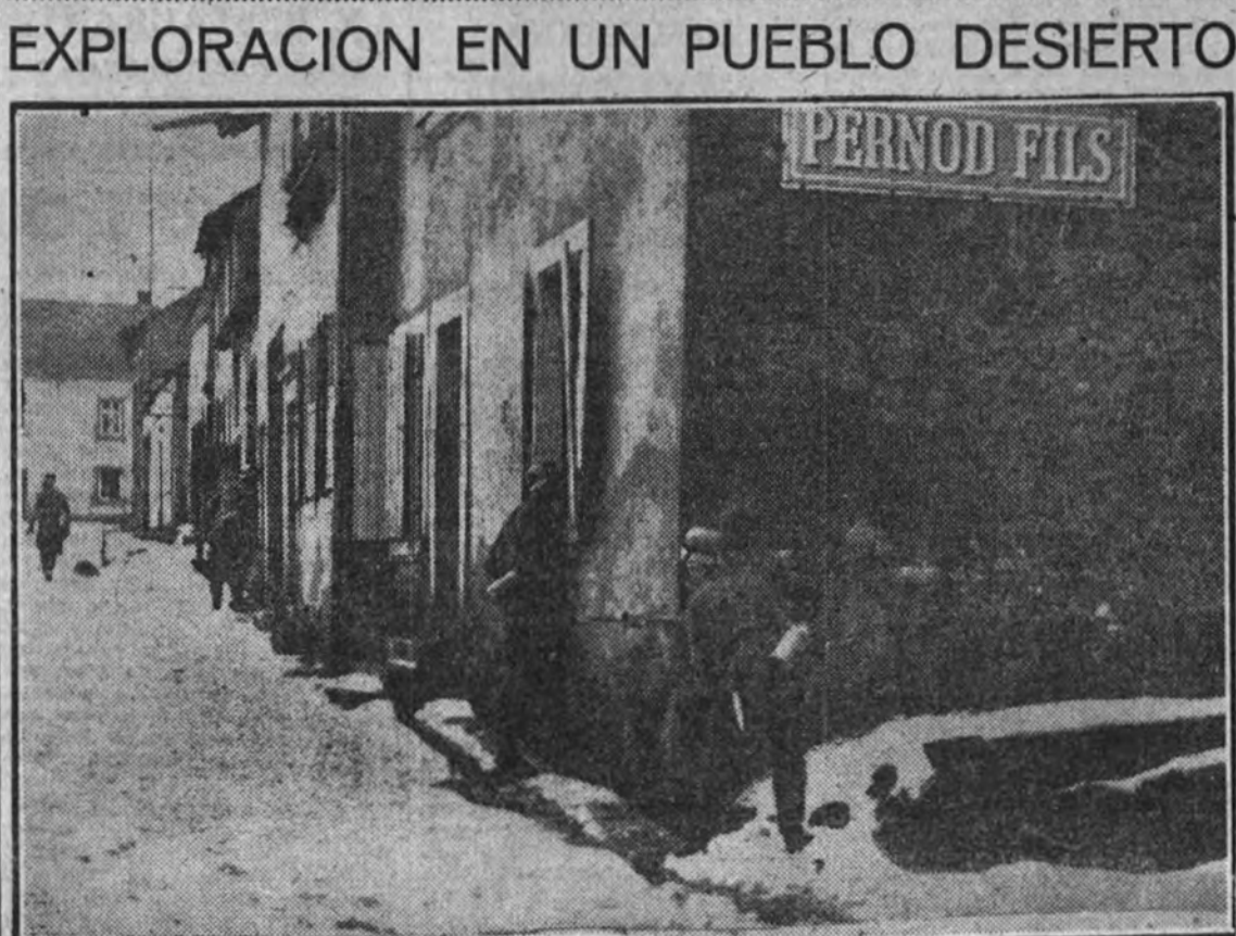
En la "tierra de nadie", una patrulla alemana realiza un reconocimiento. Los soldados avanzan por las calles desiertas de un pueblo abandonado por sus moradores.

HOY, SABADO, A LAS 25, GRAN BAILE "DE LA VICTORIA"