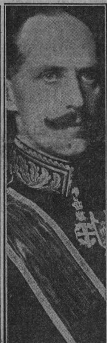
Haakon VII, de Noruega

BERLIN 9.—Importantes contingentes alemanes de aviación han participado en la acción militar, emprendida para proteger la neutralidad del Norte. En estas operaciones intervienen aviones de todos los tipos, hasta de los más modernos. Desde las primeras horas de la mañana, la aviación