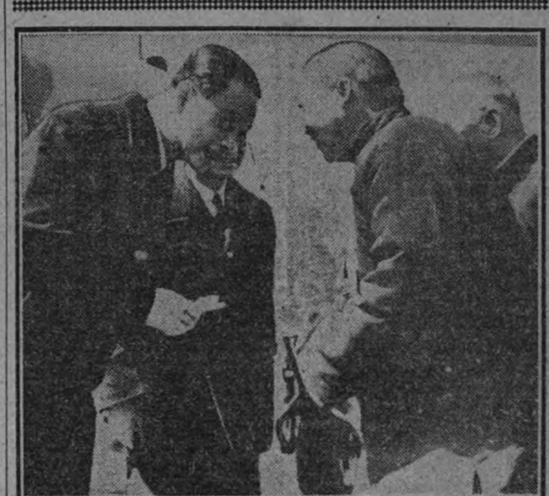
El Presidente de China, Wang-Ching-Wel, a la izquierda, recibido por el alcalde de Nankín a su llegada a esa capital para asistir a la conferencia política central.