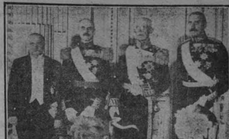
Los Jefes de los Estados nórdicos: Presidente Kallio, de Finlandia; Haakon VII, de Noruega; Gustavo V, de Suecia; y Christian X, de Dinamarca, en la última conferencia celebrada ante la invasión de Finlandia por los Soviets

MALMO 9.—Dinamarca se encuentra enteramente en manos de los alemanes. Las fuerzas del Ejército germano han ocupado virtualmente todas las ciudades y centros militares de importancia. La ocupación de Dinamarca se ha hecho en varias horas, sin ningún incidente, a causa de la decisión del Gabinete danés de no oponerse al ultimátum alemán.