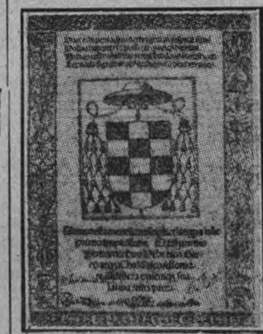
Portada del tomo primero de la Biblia políglota de Cisneros.

Con motivo de la Fiesta Nacional del Libro, la Universidad Central organizará una exposición en el salón rectoral dedicada al cardenal Cisneros. En ella se exhibirá un resumen de la extraordinaria obra realizada por esta figura preeminente de nuestra Historia, que tanta influencia tuvo en una de sus épocas de mayor esplendor. Formarán parte de esta exposición: