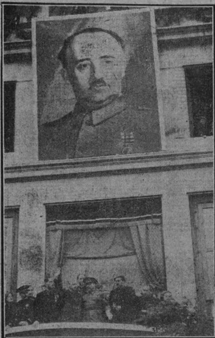
El presidente de la Junta Política, acompañado del general Aranda y autoridades y jerarquías, desde la tribuna instalada en la plaza del Caudillo, que preside un monumental retrato del Generalísimo, presenció el desfile.