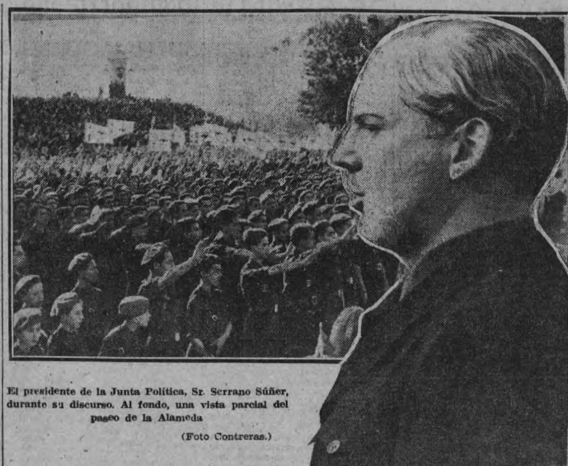
El presidente de la Junta Política, Sr. Serrano Súñer, durante su discurso. Al fondo, una vista parcial del paseo de la Alameda.

A las siete menos diez comenzó el desfile, iniciado por una sec-