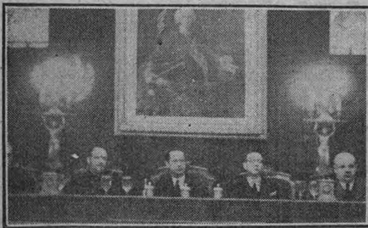
La presidencia del acto.

Concurrieron los gobernadores civiles y presidentes de Diputación de numerosas provincias