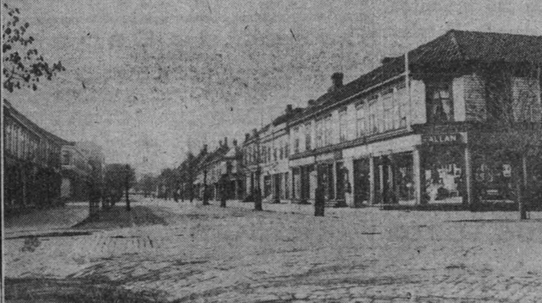
La ciudad de Trondheim, ocupada por los alemanes en sus primeros desembarcos, y ahora punto de arranque para las fuerzas que avanzan hacia Namsos, lugar de desembarco británico, y por el sur, en dirección de Dombaas, el importante nudo de las comunicaciones noruegas, cuya posesión puede dar lugar a la batalla más saliente de la guerra en Escandinavia.

Y ahora ya están los barcos de España en Canarias, esperando esas banderas unidas para siempre. Ya se buscan las flores nuevas de las coronas de homenaje y los huesos antiguos de los antiguos marinos españoles en el agua que no sabe del tiempo, pero que canta tantas glorias de España. Ya van a ondear unidas en el "Canarias" las dos banderas de todos nuestros barcos, en todas nuestras torres, en todos nuestros pechos, las dos banderas únicas. Y ahora ya están los barcos de España en Canarias, esperando esas banderas unidas para siempre. Ya se buscan las flores nuevas de las coronas de homenaje y los huesos antiguos de los antiguos marinos españoles en el agua que no sabe del tiempo, pero que canta tantas glorias de España. Ya van a ondear unidas en el "Canarias" las dos banderas de todos nuestros barcos, en todas nuestras torres, en todos nuestros pechos, las dos banderas únicas.