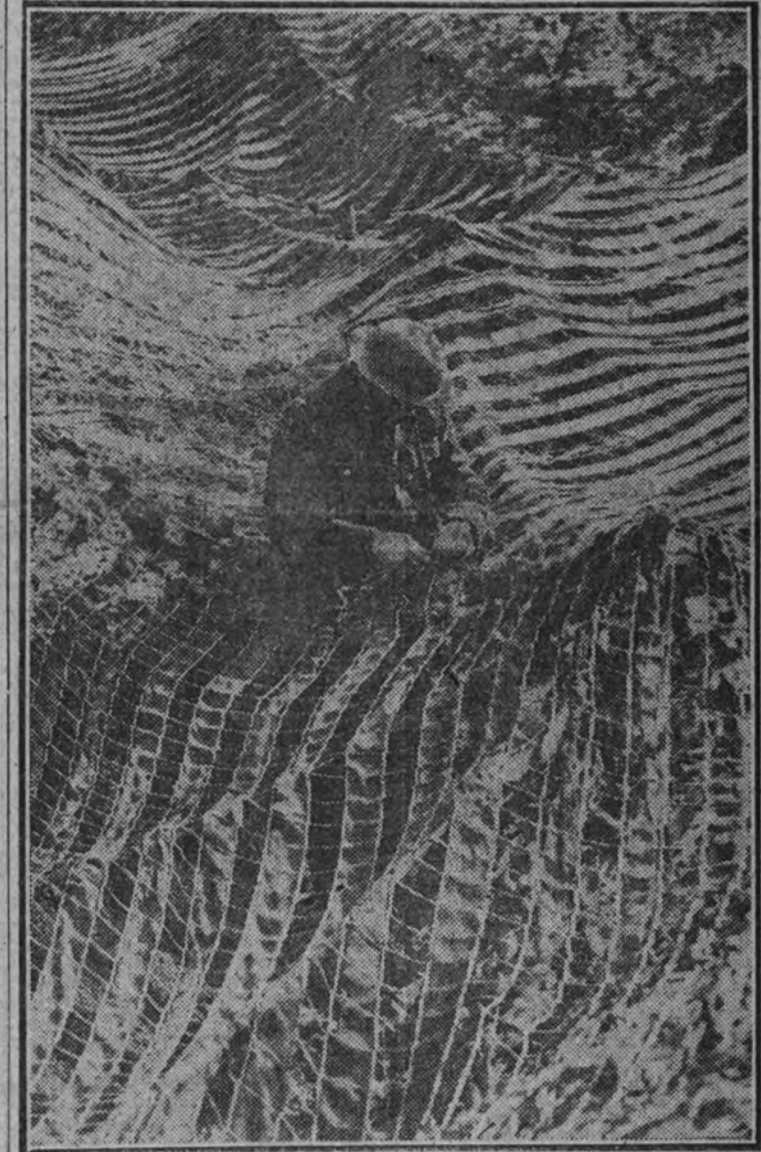
Un soldado inglés, en "cualquier parte de Francia", dedicado a la tarea de reparar las redes de "camouflage" de un puesto.