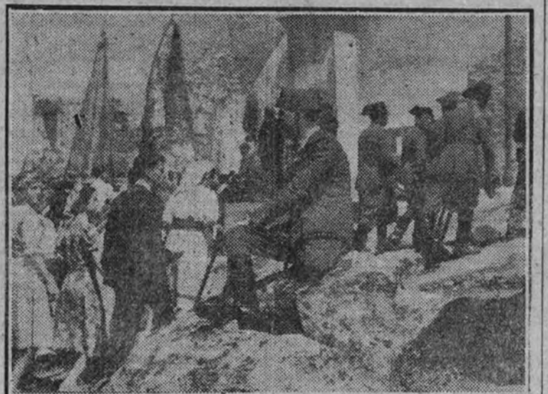
Un aspecto del acto celebrado el domingo en el Santuario de Nuestra Señora de la Cabeza.