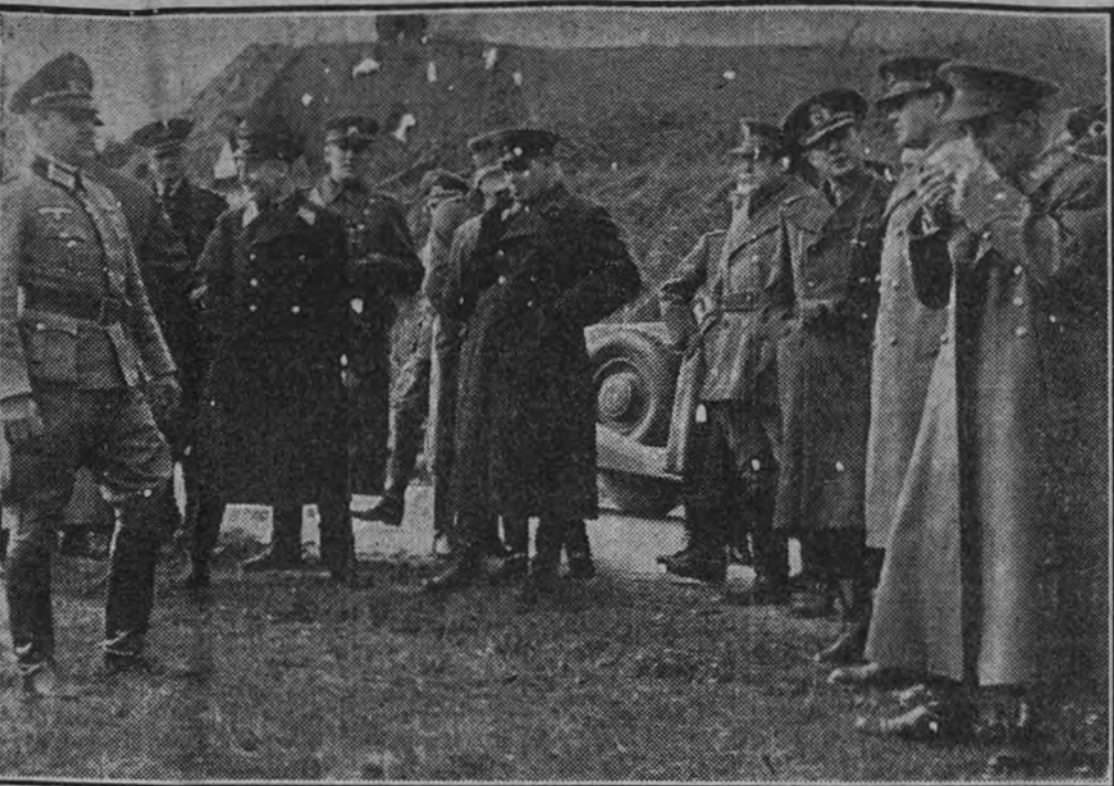
Agregados militares a las Embajadas en Berlín visitando el frente de operaciones.

"Warspite" y el "Ramillies", llegarán próximamente al Mediterráneo. Dos acorazados franceses, el "Dunkerque" y el "Strasbourg", se encuentran en el puerto de Orán. Seis cruceros ligeros y cuatro escuadras de contratorpederos están ya en este mar. También se encuentra en el Mediterráneo la mayor parte de la flota de superficie francesa. No se conoce con exactitud el número de submarinos.