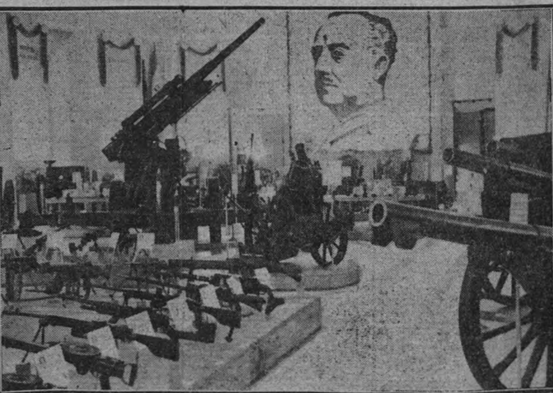
Un aspecto de la Exposición de material de guerra tomado a los rojos, abierta actualmente en San Sebastián, y que en breve será trasladada a Madrid.