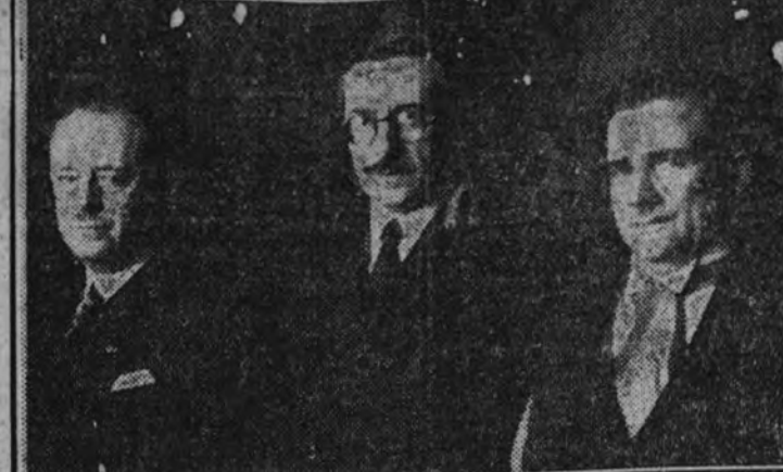
El ministro de Relaciones Exteriores con el nuevo ministro plenipotenciario de Cuba en España, a quien acompaña en su visita el señor Estadella, que cesa en aquel cargo.

A continuación continúa dirigiendo el debate el ministro Stanley, que contestó a las diversas preguntas de los diputados de la oposición. (Efe.)