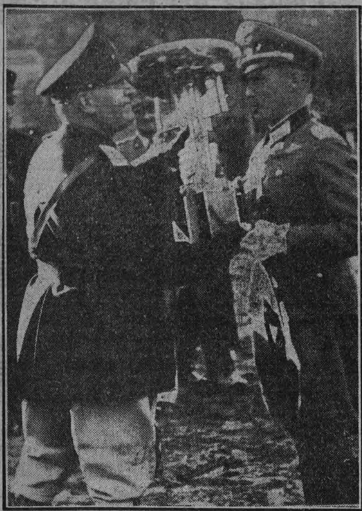
El Duque entregando la Copa Mussolini, de oro, al jefe del equipo alemán, que ha resultado vencedor en el Concurso Hípico Internacional.