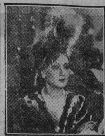
Esa Merini, la actriz italiana tan famosa y admirada de nuestro público, protagonista de "A vueltas con el mundo", que entrará en fecha próxima el Imperial.

Existiendo en este Parque diversos vehículos de tracción animal se saca a concurso su enajenación, con arreglo al pliego de condiciones que, durante el plazo de quince días, estará de manifiesto en las oficinas del paseo de las Delicias, número 46, de diez a trece horas (días laborables). Dichos vehículos podrán examinarse durante dicho plazo. Los concurrentes a la subasta presentarán en el momento de la subasta un depósito de 100 pesetas, que se devolverá al vencedor del concurso. Madrid, 9 de mayo de 1940.—El director.