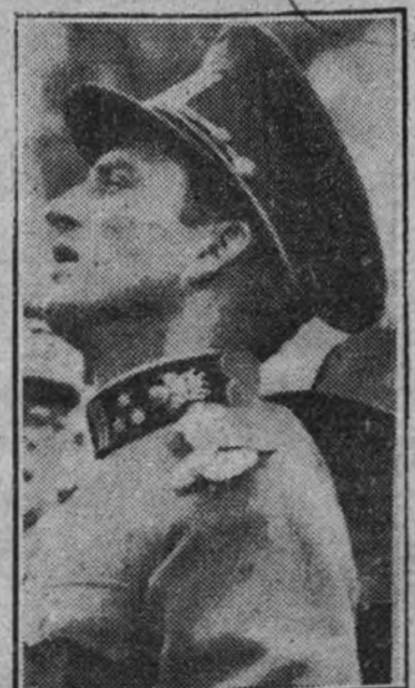
El Rey Leopoldo

BRUSELAS 10.—El jefe del partido racista, Degrelle, ha sido detenido e ingresado en prisión, así como otros varios diputados flamencos. (Efe.)