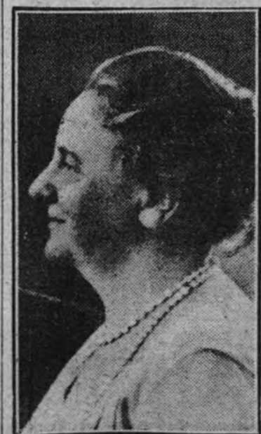
La Reina Guillermina

Las vanguardias alemanas y francesas entraron en contacto en el Mosela