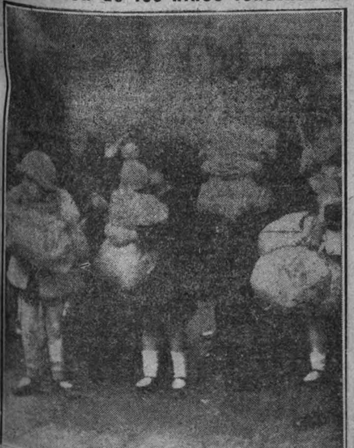
Para preservarlos de los riesgos de la guerra, las autoridades inglesas transfirieron estos días la evacuación de los niños residentes en la capital. Un grupo de niños esperando el tren que ha de llevarlos fuera de Londres.