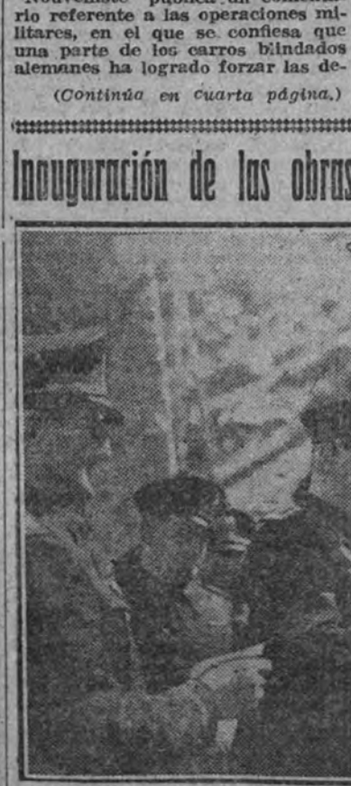
El Duce durante la inauguración de las obras del Acueducto Imperial IX de Mayo, en las Fuentes del Pesciara.