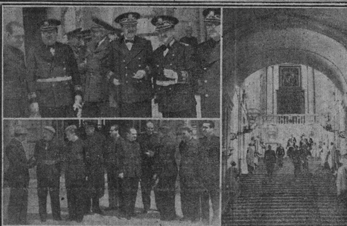
Arriba, el embajador del Perú, mariscal Oscar R. Benavides; el ministro de Panamá, D. Belisario Porras, y el ministro plenipotenciario de la Soberana Orden de Malta, D. Renato Pignatelli de la Leonessa, luego de las ceremonias de presentación al Caudillo de las cartas que les acreditan en sus cargos, al abandonar el Palacio Nacional. En el centro, algunos de los ministros nacionales y miembros del Consejo Nacional de F. E. T. y de las J. O. N. S., después de la misma ceremonia, y un aspecto de la escalera central durante el acto.